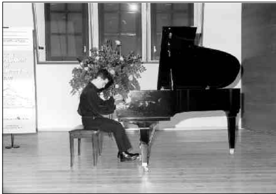
Una imatge d'un dels concerts del cicle de l'any passat

U n any més, l'Escola Municipal de Música Claudi Arimany participarà activament en el concert inaugural de la Mitja Marató Granollers-La Garriga-Les Franqueses-Granollers i en el concert que es farà durant la cursa. L'Escola de Música també ha convocat la segona edició del Cicle "Diego Hernández" de Joves Intèrprets, activitat adreçada a joves de tot Catalunya que destaquin en la seva creació i interpretació musical.