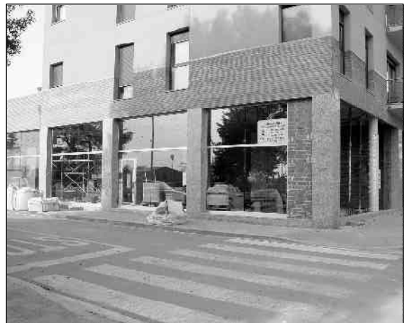
La nova oficina de Correus està situada davant de la plaça de la Llana

encarregant de fer-hi les obres d'adequació és MONMADE SA, amb un pressupost de 210.791 euros.