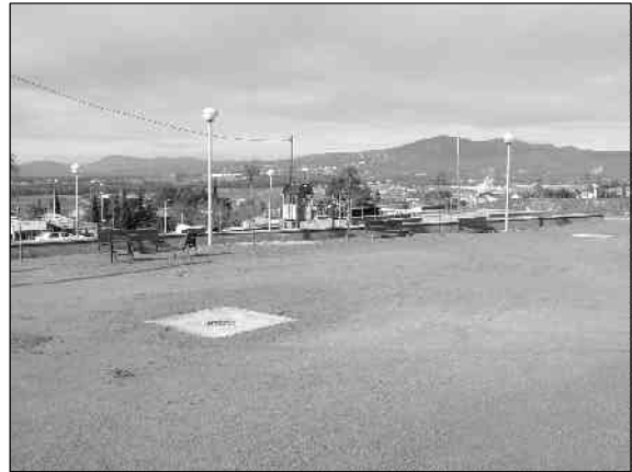
Les obres d'urbanització han permès la construcció d'un parc de 2.000 m 2 de superfície

L'actuació en aquest sector ha permès l'obertura dels carrers del Cardenal Jubany, de Lluís Companys i del Pas de la Creu, i la seva urbanització amb tots els serveis bàsics, i dels passatges de Santa Margarida i de la Senyera, que són perpendiculars a aquests carrers i destinats als vianants. A més, s'ha construït una plaça de 2.000 m 2 amb una àrea de descans i una