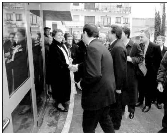
Un moment de la tradicional tallada de cinta inaugural