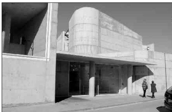
La construcció de la segona fase del Centre Cultural de Bellavista va a bon ritme

L a segona fase de construcció d'aquest centre cultural emprèn la recta final. La primera, en la qual s'ubica la Biblioteca Municipal, es va inaugurar el març del 2001. En breu s'estrenarà la segona fase, en la qual hi haurà un espai escènic amb capacitat per a més de 300 persones, una sala d'exposicions, una gran sala d'usos múltiples (festes populars, dansa, etc.), un casal infantil i juvenil,