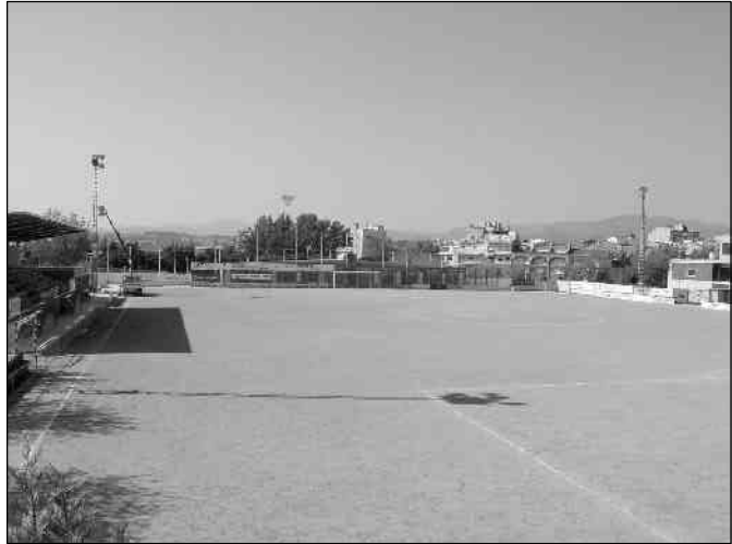
En breu, el terreny de joc del camp de futbol de Corró d'Avall deixarà de tenir el color terrós que té actualment

A més, s'ha cregut oportú incloure en el projecte la millora de les banquetes que utilitzen els equips amb la construcció de dues noves edificacions que faran de magatzem per la part posterior, així com reforçar la tanca perimetral del camp degut al seu deteriorament. El cost del projecte és de 689.692 euros.