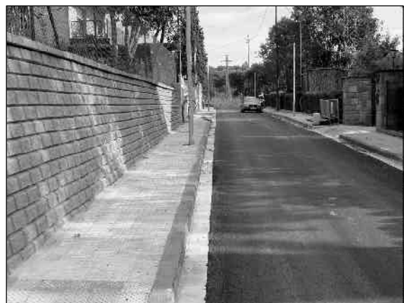
Una imatge del carrer Dr. Trias de Bes, asfaltat, amb voreres i enllumenat

L'actuació prevista també inclou la urbanització d'una zona verda a la cantonada formada pels carrers de Josep M. Boixareu i de Marià Màrgens, que comptarà amb jocs infantils, gespa, bancs i enllumenat públic. Pel que fa al trànsit,