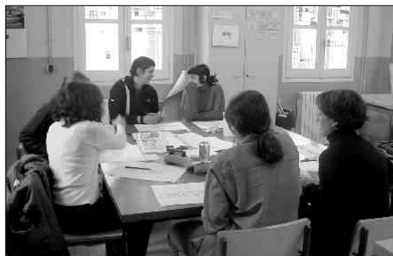
Una classe del curs de Composició i restauració de vitralls

al CIFO Vallès, al carrer de Sant Isidre, s/n (antiga caserna militar) de Corró d'Avall.