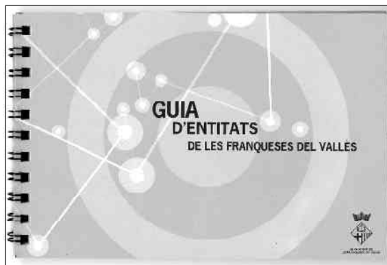
Portada de la Guia d'entitats de les Franqueses

Aquest treball vol ser un fidel recull de totes les entitats existents al municipi, tot tenint en compte que la dinàmica de la societat actual fa que aquest sigui un àmbit canviant, d'on van sorgint nous moviments i grups que es consoliden en el