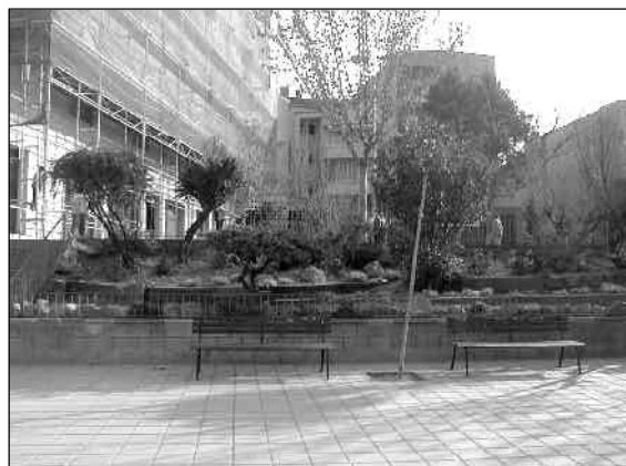
A la plaça de l'Esbarjo s'han fet diverses terrasses i s'hi han plantat noves espècies vegetals

Una de les actuacions realitzades és a la plaça de l'Esbarjo, a Bellavista, on el pendent dels talussos de la plaça provocava la contínua pèrdua de terra i el descalçat de les plantes que hi havia. Ara s'hi han fet diverses terrasses amb el suport