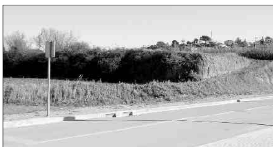
El terreny on es construirà la nova escola de primària

E l govern municipal està treballant per a la posada en marxa el curs vinent d'una nova escola d'educació infantil i primària al sector del Mas Colomé. La construcció de la nova escola suposarà la consecució d'un mapa escolar complet de l'educació obligatòria a les Franqueses per cobrir totes les necessitats de matriculació i disposant, a més, de centres nous i amb tots els equipaments necessaris.