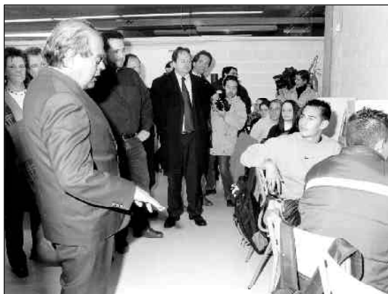
El president Pujol parlant amb alumnes de l'IES Lauro

L'acte, en el qual van participar tots els alumnes, es va cloure amb un aperitiu i una roda de premsa, en la qual el president de la Generalitat va ressaltar la qualitat dels centres educatius del nostre país.