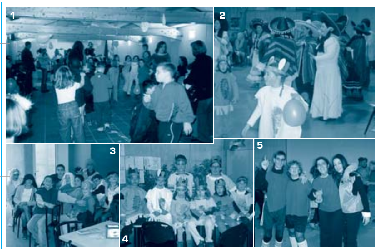
1. Gresca i xerinxola al Casal infantil municipal de Corró d'Avall; 2. Mexicanes ballant al Centre Cultural de Bellavista; 3. Unes noies molt sospitoses; 4. La tribu índia de Bellavista; 5. Els joves de l'associació Apadis, de futbolistes

També a la tarda del dia 21 de febrer, els veïns de Llerona van poder gaudir de la seva festa de Carnestoltes gràcies al Casal Parroquial de Llerona. L'animació va anar a càrrec del grup de pallasos Els arlequins.