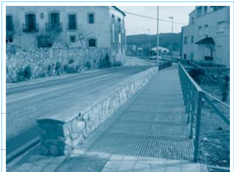
La nova vorera permet donar continuïtat a la que prové del nucli de Mil Pins, unint així els dos nuclis urbans

soterrat diversos serveis telefònics i d'electricitat, quedant convertit l'indret en un lloc transitable, útil i estètic, molt al contrari que abans d'iniciar les obres.