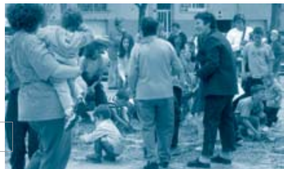
Moltes parelles joves han vingut a viure a les Franqueses atretes per la seva qualitat de vida

Corró d'Avall, amb 6.522, Llerona, amb 826, Corró d'Amunt, amb 359, i Marata, amb 179.