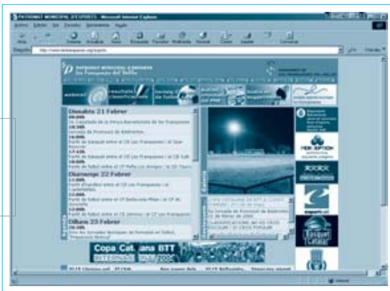
Aquesta és la pàgina inicial del nou web d'esports de l'Ajuntament de les Franqueses

Aquest portal neix amb la voluntat de ser una eina que permeti potenciar i difondre tota la tasca que realitza tant el propi Patronat Municipal d'Esports com el conjunt de les entitats esportives locals, al voltant del món de l'esport de les Franqueses, a l'hora que ha de servir per fomentar el treball en xarxa entre el conjunt dels agents esportius del municipi.