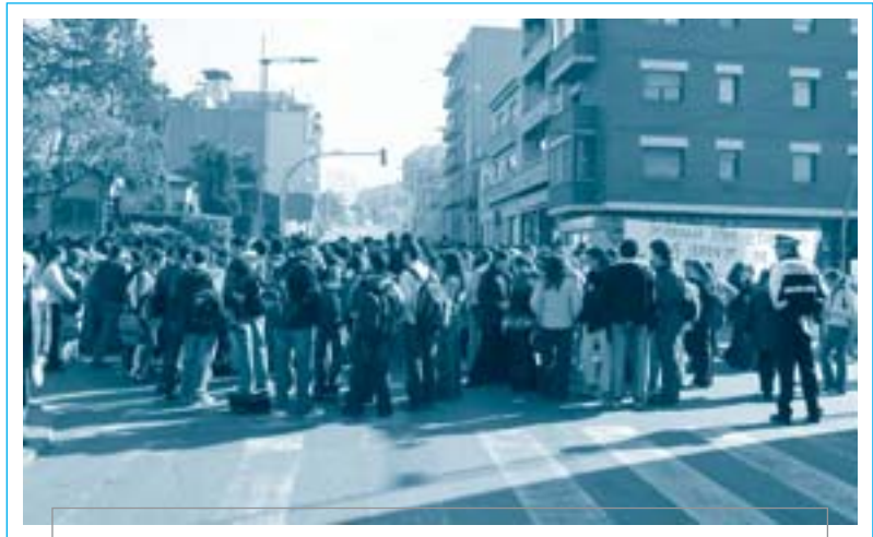
Els alumnes de l'IES Lauro van reclamar una solució urgent a la fatídica cruïlla

Des del dia de la tragèdia, els seus companys s'han marcat un objectiu: que aquest fet no torni a passar. És per això que es van posar de seguida a recollir firmes (en van aconseguir més de nou mil) per demanar a l'Ajuntament de Granollers que «reordeni de forma urgent el trànsit en aquesta cruïlla per evitar més accidents en aquest punt negre». La segona