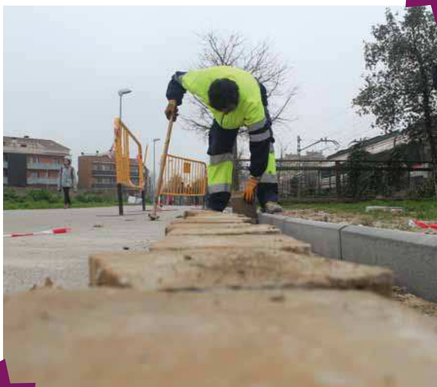
Planes de ocupación trabajando en el pipican de Bellavista

Las personas seleccionadas para desarrollar los proyectos incluidos en el Plan de Ejecución Anual beneficiario de la subvención deben residir, según establece la convocatoria, de forma