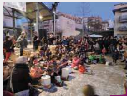
Festa de la Infància 2016