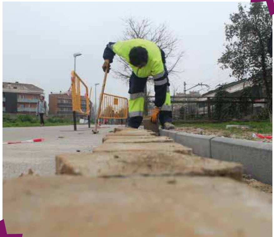
Plans d'ocupació treballant al pipicà de Bellavista

Les persones seleccionades per desenvolupar els projectes inclosos al Pla d'Execució Anual beneficiari de la subvenció han de residir, segons estableix la convocatòria, de forma obligatòria en el cas dels plans