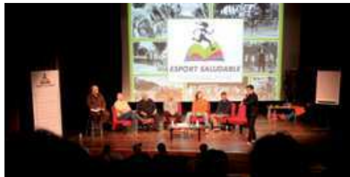
Els ponents del debat de la jornada Esport Saludable

El passat 19 de gener es va celebrar per primera vegada la jornada Esport Saludable: educació i valors , organitzada pel Patronat Municipal de Cultura, Educació, Infància i Joventut, amb el Patronat Municipal d'Esports. L'acte va reunir personalitats vinculades al món esportiu perquè s'expliquessin i debatessin sobre la importància de la pràctica de l'esport com a eina per a l'educació i com a promotora de valors cívics i de bona convivència, més enllà de la mera competició. Així mateix, ha servit