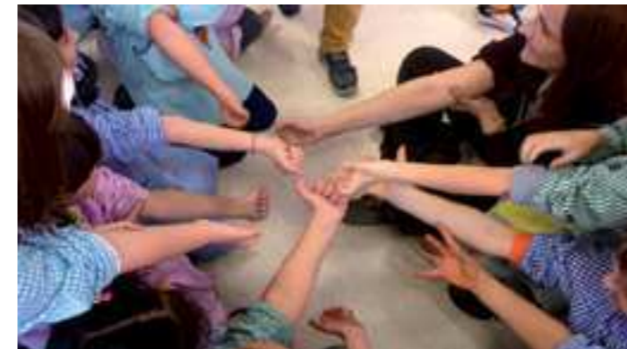
Campanya de donació de sang a l'Escola Colors

El proper dimecres 8 de febrer a la tarda, els franquesins i les franquesines podran participar en una nova campanya de donació de sang.