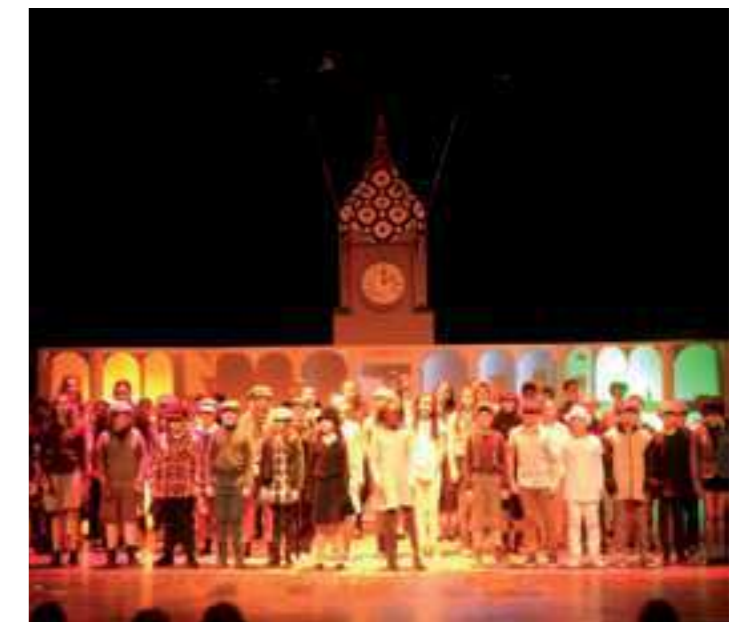
El final de l'espectacle Finestres al món

L'estrena va ser tot un èxit. A través del teatre, el públic va poder conèixer la vida d'en Joan Sanpera, una personalitat històrica i clau en la història de les Franqueses. L'èxit de l'obra també és gràcies als participants que l'han fet possible des de davant i des de darrere l'escenari. Aquesta acció s'emmarca dins del Projecte Educatiu Comunitat i Escola creat i impulsat pel Patronat Municipal de Cultura, Educació, Infància i Joventut amb la implicació de les escoles, els instituts i les AMPA del municipi.