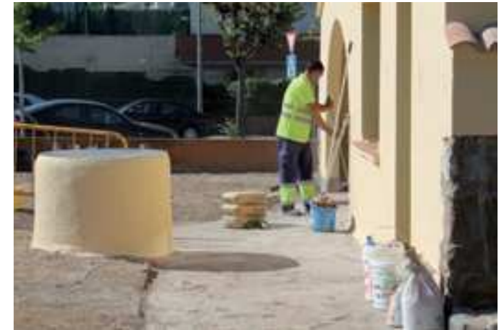
Pla d'ocupació treballant en la construcció de la nova oficina de Polítiques Socials

Per a inscriure's a la borsa de treball, podeu contactar amb l'àrea de Dinamització Econòmica situada a Can Ribas-Centre de Recursos Agraris, al telèfon 938 403 749 o mitjançant el correu electrònic dinamitzacio@lesfranqueses.cat