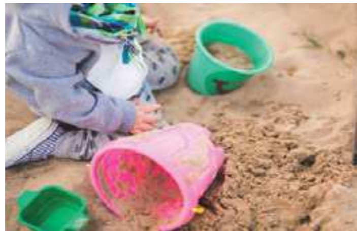
Tarifació social 2017

és de l'1 de gener fins al 28 de febrer. Per a més informació podeu posar-vos en contacte amb el Servei d'Atenció a la Ciutadania de l'Ajuntament o al Servei d'Atenció a la Ciutadania de Bellavista Activa, als telèfons 938 467 676 i 938 615 435, respectivament.