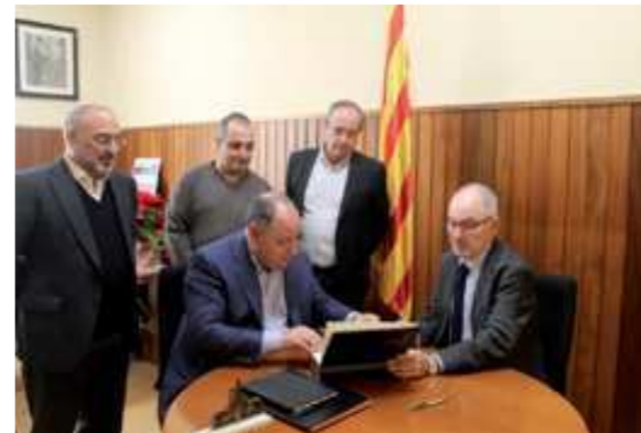
L'alcalde, el Síndic de Greuges de Catalunya i regidors de l'Ajuntament

El passat mes de desembre, l'alcalde, Francesc Colomé (CiU), i el Síndic de Greuges de Catalunya, Rafael Ribó, van signar un conveni de col·laboració per tal de facilitar i promoure l'accés dels veïns i veïnes del municipi al Síndic, i avançar en la millora de la gestió de l'atenció ciutadana.