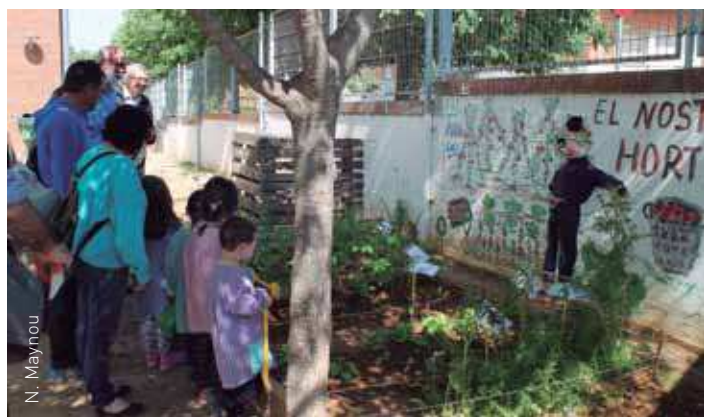
Visita al pati de l'Escola Joan Sanpera i Torras