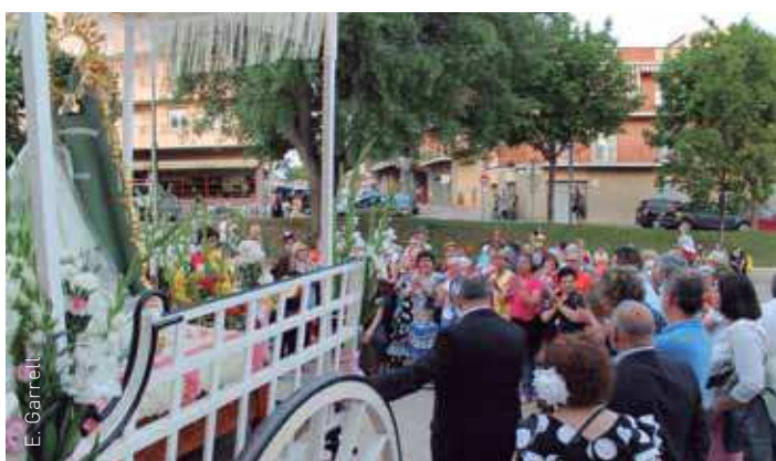
Les autoritats van fer una ofrena floral a la plaça de l'Ajuntament

Totes les fotografies al Flickr Ajuntament de les Franqueses del Vallès