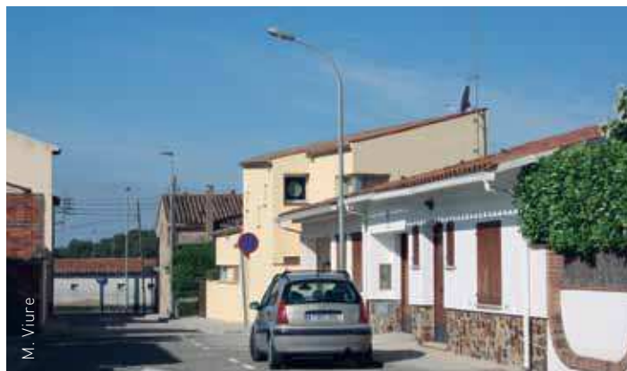
Carrer del Lliri, a Corró d'Amunt

D'altra banda, al mes de maig es va acabar d'asfaltar el petit pàrquing de la part nord de la zona esportiva , al principi del camí de Can Blanxart a Can Bertran. En total hi ha 18 places per a vehicles, una de les quals reservada a minusvàlids.