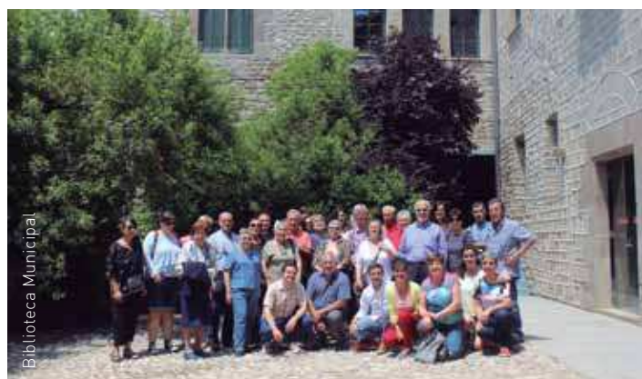
Fotografia del grup participant

El recinte va patir l'abandonament fins que el 1907 va ser adquirit per la família de l'artista Ramon Casas, la qual, de la mà de l'arquitecte Josep Puig i Cadafalch, va iniciar-ne la recuperació.