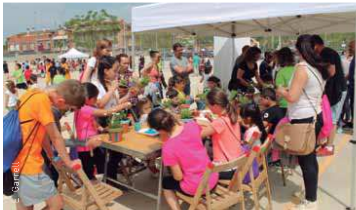
Les entitats van preparar tallers de motius primaverals