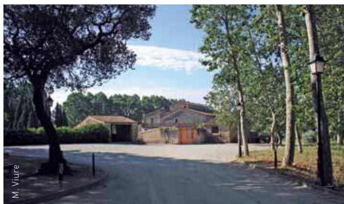
Can Sala, a Corró d'Amunt