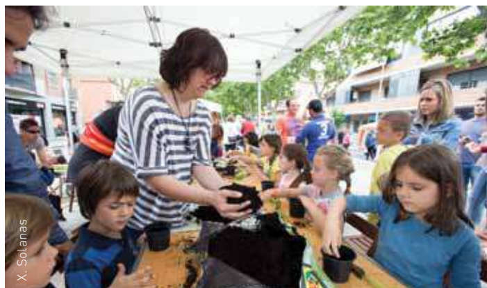
Es van programar molts tallers pensats per als nens i nenes

A la tarda la pluja va obligar a anul·lar la 10a Cantata infantil. Per la seva banda, tot i que amb mitja hora de retard, l' Orquestrina Franquesina va poder fer el seu debut.