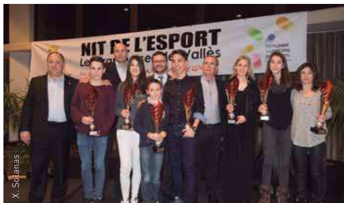
Els millors esportistes de la temporada 2014-2015