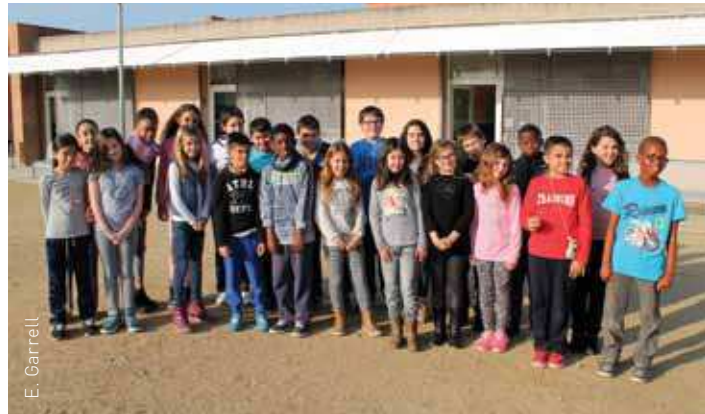
Els alumnes de la classe de 5è A de l'Escola Bellavista-Joan Camps