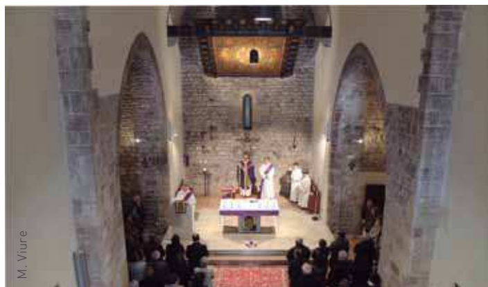
La il·luminació i la pintura són alguns dels canvis més visibles