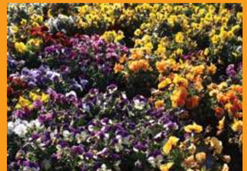
Els pagesos no només hi porten comestibles a la Cooperativa. També hi podem trobar plantes ornamentals, eines o altres materials