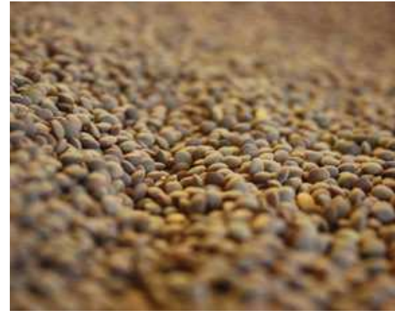
A la Cooperativa s'hi poden trobar productes d'alta qualitat. Les llegums en són un exemple i la mongeta del ganxet n'és l'estrella

aquell tomàquet compleix les seves expectatives. Si preu-qualitat s'adeqüen o si el seu estómac ja es conforma.