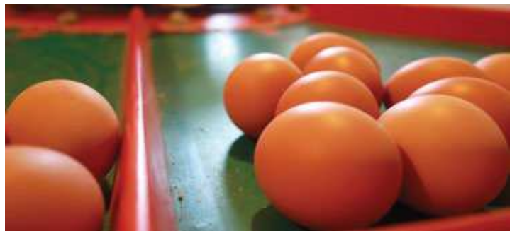
La família de Can Pau Trias ofereix, entre d'altres, patates i ous. La màquina dels ous serveix per calibrar-los i etiquetar-los