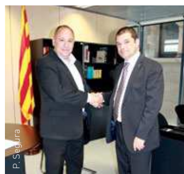
La reunió s'ha fet a la Diputació

Adaptar la pàgina web de les Franqueses a les noves tecnologies així com modernitzar-ne el seu disseny va ser un altre dels punts tractats. La renovació de la web té l'objectiu final d' oferir un millor servei al ciutadà facilitant-ne l'accés i la difusió dels continguts .