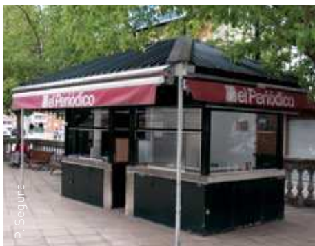
El quiosc té previst obrir de nou el 28 de maig

L'Àrea d'Obres i Serveis ha fet una petita actuació, d'escomesa de llum, per habilitar el quiosc que ja té els corresponents permisos. L'obertura del quiosc està prevista pel dilluns 28 de maig.