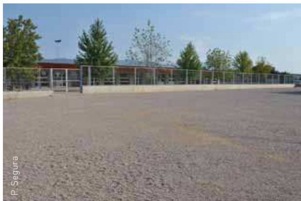
El solar es troba entre l'escola Camins i la comissaria

Aquestes obres han estat realitzades per l'empresa Bigas Grup, adjudicatària del servei de manteniment i millora dels camins de les Franqueses del Vallès.