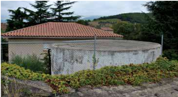
La connexió dels dipòsits d'aigua ha entrat en funcionament aquest estiu

A quest estiu va entrar en funcionament la connexió d'aigua corrent a la urbanització de Can Suquet i al nucli urbà de Corró d'Amunt provinent de la canonada que ha fet Aigües Ter Llobregat (ATLL) entre els dipòsits de Santa Digna i de Can Suquet. Fins ara aquest dipòsit era el qui subministrava aigua a la zona.