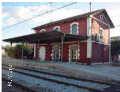
Millora la seguretat a les andanes i vies

Adif enviarà una carta als veïns propers a l'estació per informar-los del procés de les obres.