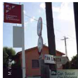
Nou horari a partir de l'1 d'octubre

El nou trajecte sortirà de les 19.15 h de Granollers i pujarà fins a Corró d'Amunt (19.33 h) on donarà la volta i tornarà a baixar fins l'estació d'autobusos de Granollers on arribarà a les 19.58 h. Les parades entre un municipi i l'altre seran les mateixes. L'ampliació horària beneficiarà els veïns de Marta i Corró d'Amunt que sol·licitaven al consistori una major freqüència dels autobusos. Per més informació podeu consultar els horaris i les parades a la pàgina web municipal.