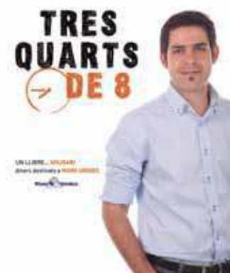
Portada del llibre

La publicació Tres quarts de 8 té un caràcter solidari. Els diners derivats de la seva venda es destinen a l'ONG Mans Unides (delegació del Vallès Oriental) per a un projecte educatiu concret, la construcció d'un institut de secundària a la ciutat de Bo (Serra Lleona, Àfrica).