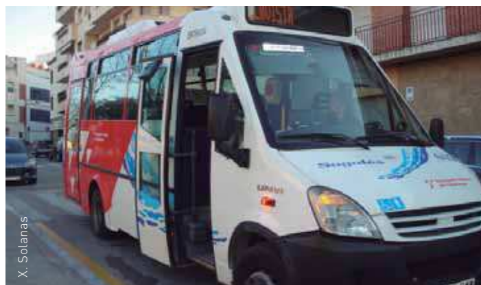
Noves targetes socials per al transport d'autobús

El preu de les targetes T10 per a joves i T10 jubilats és de 6.35 eu-