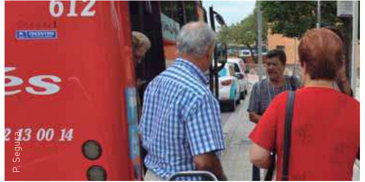
Gran augment del nombre de passatgers a l'autobús municipal

Després d'analitzar les dades del servei d'autobús municipal de l'any 2011, amb una pèrdua d'un 45% de viatgers respecte a l'any 2010, l'Àrea d'Obres i Serveis de l'Ajuntament va proposar un canvi en el recorregut per aconseguir recuperar el nombre de viatgers.