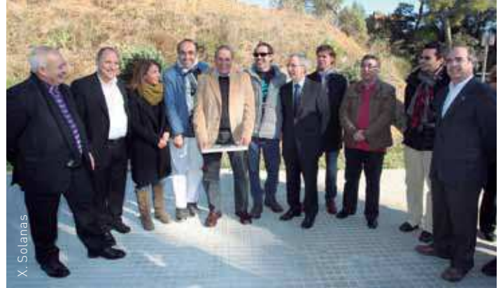
25 monitors han col·laborat amb el programa Entrena la Mitja