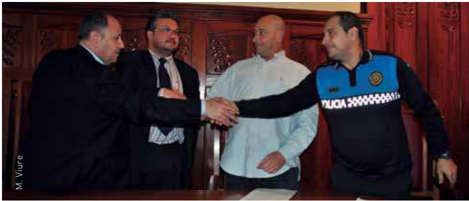
El Consistori atén les demandes del cos policial