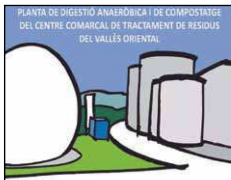
La visita es farà el dissabte 23 de febrer

Les persones interessades en la visita es poden inscriure