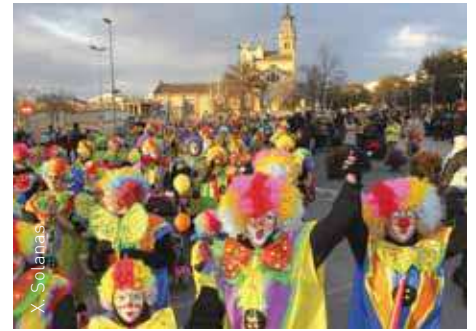
Rua de comparses a Corró d'Avall

L'Associació de Veïns de Bellavista , l'Associació de Veïns de Sant Mamet de Corró d'Amunt i l'entitat Festes Laurona de Llerona van organitzar actes i concursos de Carnaval als respectius pobles.