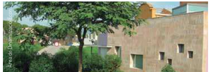
El Viver d'Empreses es troba al carrer Cal Gabatx, s/n, de les Franqueses

creació i la implantació de noves empreses, en aquest mercat altament competitiu, a través del lloguer d'espais on ubicar temporalment les empreses i d'un seguit de serveis que faciliten l'inici de l'activitat.