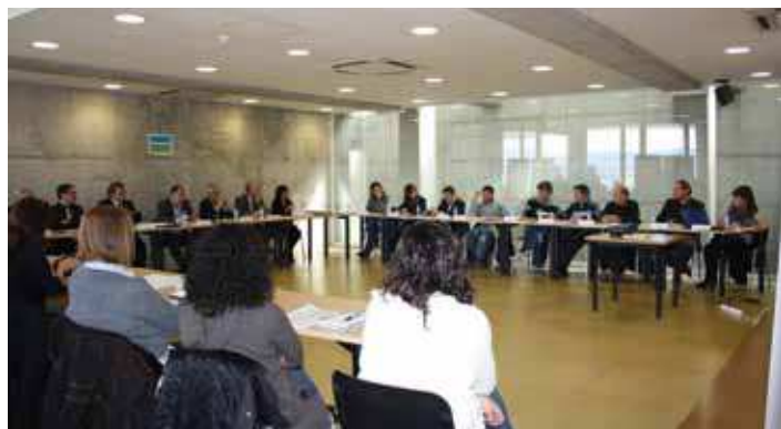
Reunió del 2n Comitè de Pla de Barris de Bellavista