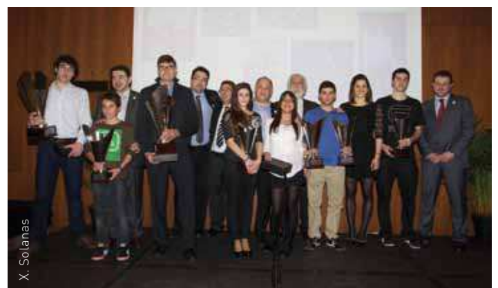
Els millos esportites de la XVII Nit de l'Esport de les Franqueses