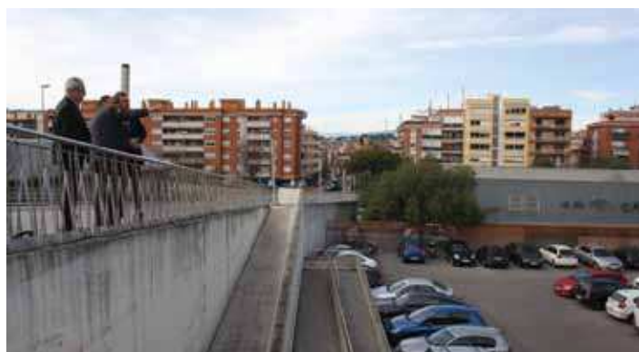
L'alcalde i el regidor ensenyen el barri al delegat del Govern