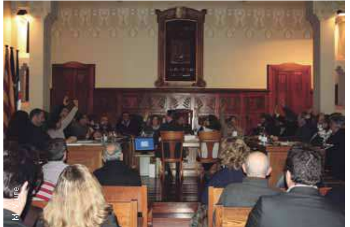
Moment de la votació dels partits que donen suport a la declaració

El Ple de l'Ajuntament celebrat al gener va aprovar una moció de suport a la declaració de sobirania i al dret a decidir del poble de Catalunya votada al Parlament. La proposició, presentada per Esquerra Republicana de Catalunya, va validar-se amb els vots favorables de CiU, UPLF, CpF i LFI. Hi van votar en contra PSC, PP i PxC.