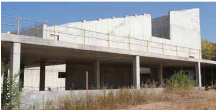
La ciutadania pot les presentar propostes de l'1 de maig al 15 de juny

Per una gestió viable del futur equipament cal tenir en compte les despeses de manteniment . En aquest sentit es pot valorar la possibilitat d'instal·lar-hi activitats que generin recursos.