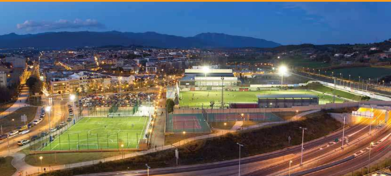
Zona esportiva municipal de Corró d'Avall