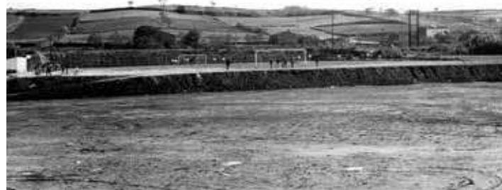
El camp de futbol de Corró d'Avall, al cap de poc d'haver-se construït

teniment per a Adults i per a la Gent Gran així com la col·laboració amb la Fundació Apadis d'ajuda a les persones discapacitades.