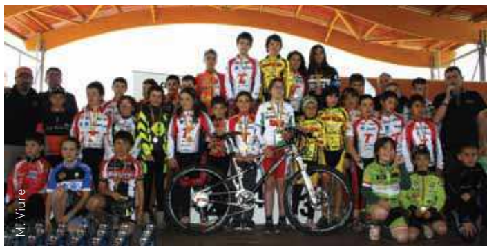
Ciclistes de la Kid's Cup