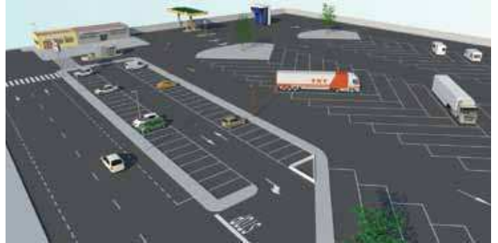
Imatge virtual de l'àrea d'estacionament de camions

L'estacionament tindrà una capacitat per a 250 vehicles però també hi ha la possibilitat d'incloure altres serveis. El regidor de Dinamització Econòmica, Javier Álvarez, explica: "s'hi podran oferir altres serveis com ara cafeteria, canvi de pneumàtics o benzinera".