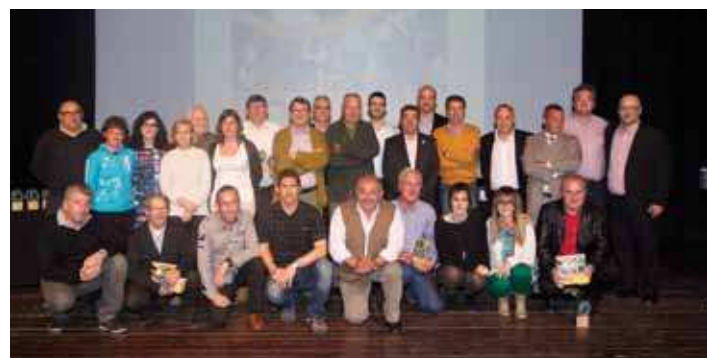
Mencions a les persones que han treballat o treballen al Patronat

L'Ajuntament de les Franqueses i el Patronat donen suport a la tasca que realitzen les entitats esportives del municipi des dels inicis de la seva constitució, tant a nivell de cessió de material i ús d'instal·lacions com en l'organització d'activitats i atorgament de subvencions. Actualment al municipi hi ha una trentena d'entitats esportives. En destaquen les de futbol, bàsquet, handbol, atletisme, arts marcial, ciclisme, tennis, petanca, tir amb arc, entre d'altres.