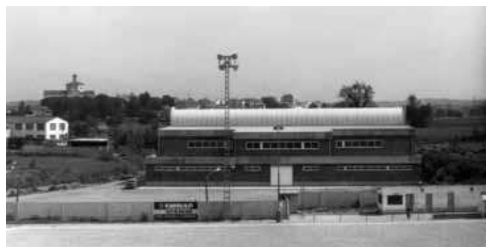
El pavelló poliesportiu municipal, poc després de la seva construcció

Conscient que la pràctica esportiva contribueix de forma clara a millorar la qualitat de vida, el Patronat té com a una de les seves funcions més importants la promoció i l'organització d'activitats per a tots els sectors de la població. En destaquen el Programa de Man-