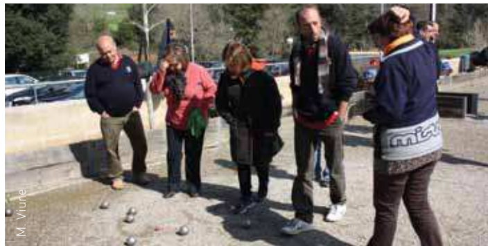
Discussió de la jugada a les pistes de petanca de Corró d'Amunt

Les partides van allargar-se tot el matí. Als vols de les 10 es va fer una parada per gaudir d'un esmorzar de forquilla i ganivet. Es va entregar un record als representants de les entitats i un metre a tots els assistents. El conseller va rebre un exemplar del llibre que commemora el 30è aniversari del Patronat, 30 anys al teu costat .