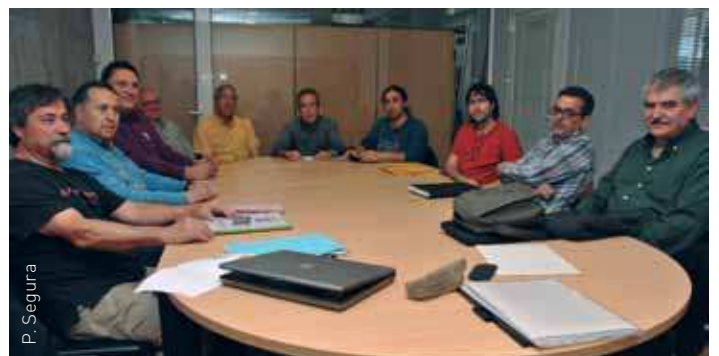
Consens per fer una Festa Major de Bellavista oberta i participativa