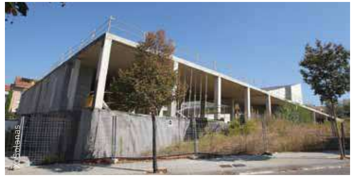
Es seleccionaran tres propostes finals i s'obrirà la votació