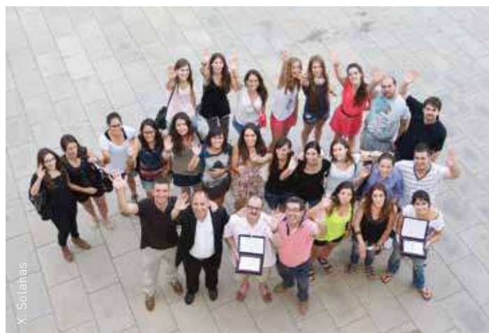
Els equips del CE Llerona i del CB Les Franqueses mostrant les plaques