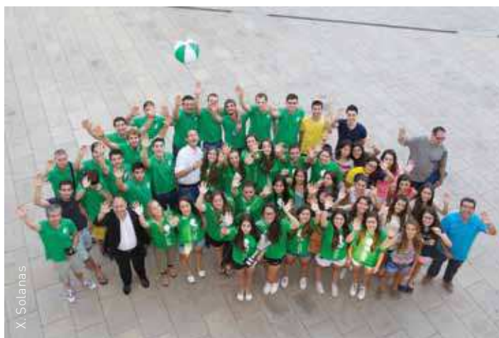
Els tres equips d'handbol homenatjats

L'acte d'homenatge va consistir en l'atorgament de plaques als representants de cada equip, entrega d'un petit obsequi i signatura en el Llibre d'Honor d'Esports del municipi per part de cada integrant dels clubs, foto de grup i pisolabis final al darrere de l'edifici consistorial.