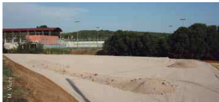
També es resoldrà el perill que suposaven els cotxes a les vores

Aquesta actuació solucionarà també el problema del perill per als vianants que es produïa a la carretera quan els vehicles hi aparcaven indiscriminadament.