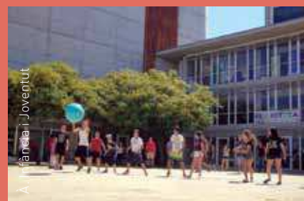
A. Infància i Joventut

Org. Casals infantils municipals de Bellavista i Corró d'Avall