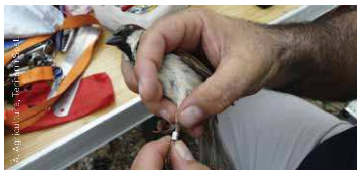
Anellament d'un pardal

Els anellaments permeten fer un seguiment de les poblacions d'ocells del país: quina és l'evolució de les poblacions, la diversitat d'espècies, l'estat nutricional i de salut dels ocells, si emigren i cap a on o bé saber on són colònies sedentàries.