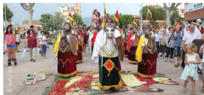
Tradicional trepitjada de catifes amb l'animació dels cavallets de Barberà

Per la seva banda, Corró d'Amunt va reivindicar la seva tradició rural amb una catifa que mostrava les grans zones boscoses del poble, la feina al camp i els animals de les masies. A la catifa també hi havia uns cartells molt pedagògics que senyalitzaven quins materials s'havien utilitzat per confeccionar-la: ginesta, blat, pi, pinyons, marro del cafè, etc.