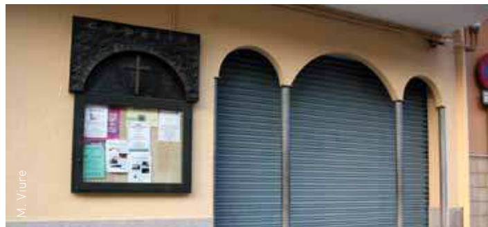
L'església es va construir el 1994 amb els esforços dels mateixos veïns