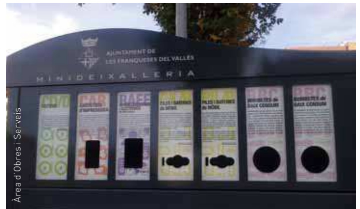
Àrea d'Obres i Serveis

Aquesta actuació no ha tingut cap cost per a l'Ajuntament, ja que tant la seva instal·lació com la gestió dels residus (recollida i tractament) es paguen amb la publicitat que porten aquests punts.