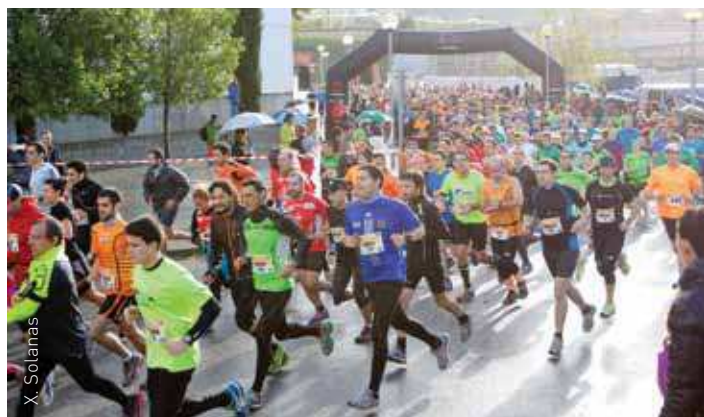
Un moment de la sortida de la prova

A banda de la vessant esportiva, aquesta cursa té l'objectiu de recaptar diners per a la lluita contra el càncer de ronyó. Els diners recaptats enguany (un mínim de 3 euros per inscrit, segons Aragonès, més l'aportació de l'empresa patrocinadora Pfizer i la que farà l'Ajuntament de les Franqueses) es donaran, com l'any passat, a la