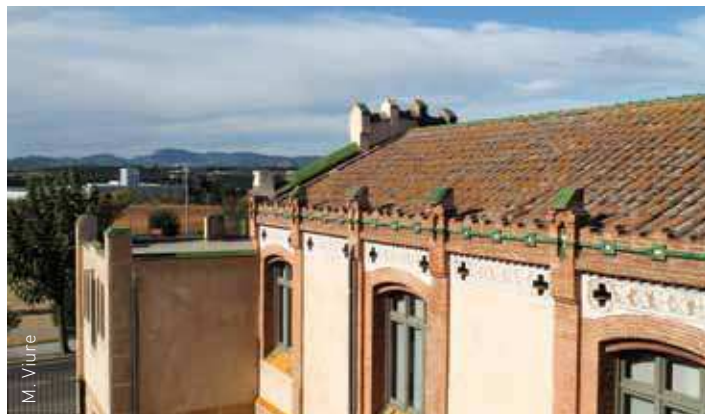
Es canviaran totes les teules però s'aprofitaran les que estiguin bé