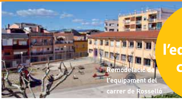
Remodelació de l'equipament del carrer de Rosselló