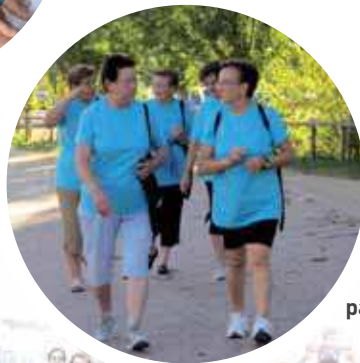
Bellavista, pas a pas