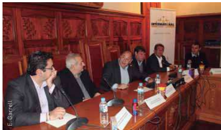
Instantània de la roda de premsa de presentació del torneig