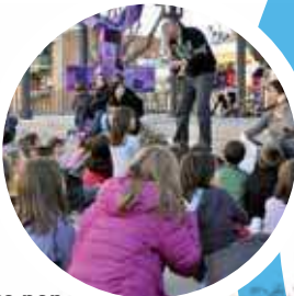
Mou-te per la igualtat