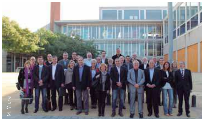
Assistents al Consell d'Alcaldes celebrat al Centre Cultural de Bellavista

La sessió es va centrar, però, en les convocatòries d'ajuts a menjador, conegudes també per "beques menjador". A tots els alcaldes els consta que el marge de convocatòria és insuficient per a les necessitats de la població. Per aquest motiu, el Consell d'Alcaldes va destacar que la voluntat és present en totes les àrees de Polítiques Socials i que també en té constància des de la conselleria de Benestar Social i Família el Govern de la Generalitat.