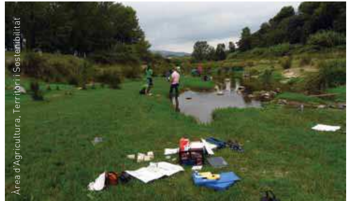
Àrea d'Agricultura, Territori i Sostenibilitat

Les principals intervencions en l'espai es duran a terme durant els propers mesos de febrer i març i se centraran en l' eliminació i eradicació d'espècies de flora exòtica invasora , així com en la revegetació amb espècies autòctones. Durant la resta de l'any s'instal·laran refugis per a la fauna, es realitzaran actuacions de manteniment i eliminació de deixalles i es potenciarà la comunicació