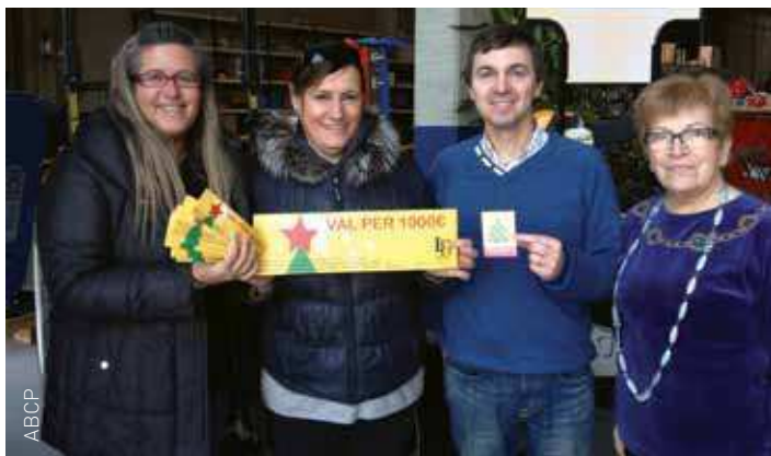
La guanyadora amb representants de l'ABCP i de Tallers Franqueses, SL