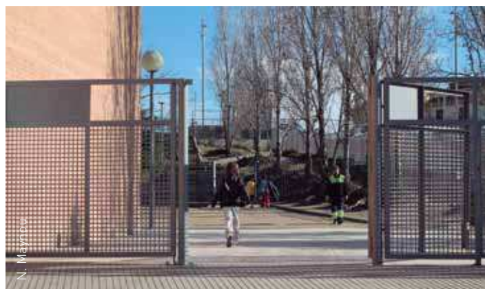
Entrada a l'Escola Bellavista-Joan Camps

La metodologia de treball per elaborar aquest estudi consta d'una primera part d'anàlisi i diagnosi de l'estat dels camins i recorreguts escolars i dels hàbits tant de pares/mares com d'alumnes,