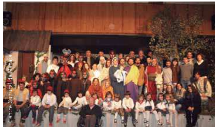
El grup d' Els Pastorets de Marata

Reconeguts per la seva fidel versió de l'obra de Josep M. Folch i Torres, els de Marata s'han convertit en uns referents a Catalunya gràcies a la seva experiència.