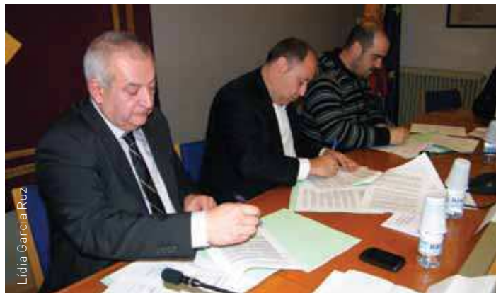
Moment de la signatura del conveni 'Catalunya Emprèn'

El projecte 'Catalunya Emprèn' impulsarà l'emprenedoria local assessorant les persones que vulguin emprendre un negoci, oferint un acompanyament des de la globalitat als emprenedors, posant al seu abast recursos i formació necessària per al desenvolupament de la seva activitat, així com tramitant i buscant ajuts i finançament