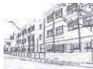
Escola Guerau de Liost