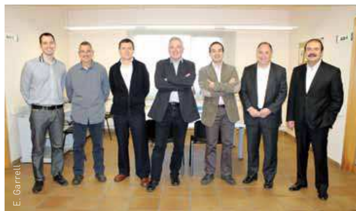
Membres de la junta directiva, amb l'alcalde i el delegat de PIMEC

Els primers projectes que s'han endegat han estat presentar una interessant millora de velocitat de connexió a Internet que pot arribar a 20 Mb reals per a les empreses del municipi a uns costos molt