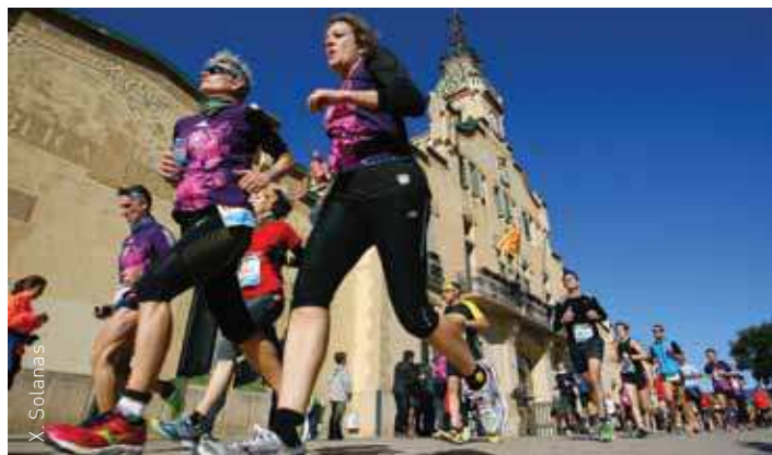
El recorregut de la Mitja passa per davant de l'edifici consistorial

La Mitja va transcórrer sense incidències remarcables.