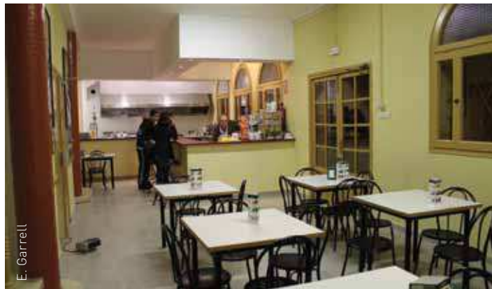
Amb les reformes, el bar té espai per posar-hi més taules