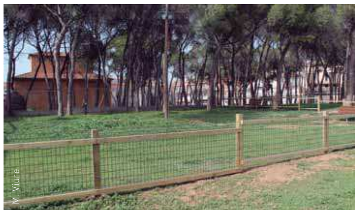
La zona d'esbarjo canina es troba just al darrere del Casal Cultural