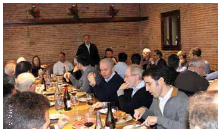
L'esmorzar-col·loqui es va celebrar al restaurant Cal Cinc

La jornada va servir perquè els empresaris de diversos sectors econòmics poguessin formular diverses preguntes, suggeriments i peticions al conseller. Felip Puig va destacar que enguany es preveu un creixement de l'economia catalana del 0,9% i la creació de 3.000 llocs de treball i va encoratjar les empreses a seguir treballant amb responsabilitat.