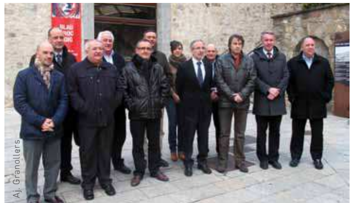
El grup d'alcaldes de la C-17 assistents a la trobada de Ripoll

promoure l'activitat turística a l'eix de la C-17, des del Circuit de Catalunya fins al turisme de muntanya.