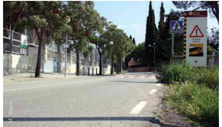
La Diputació posarà un altre ressalt a la carretera que travessa el poble