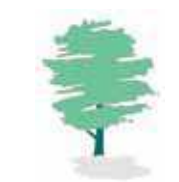
Institut El Til·ler

dl, 10 de març, de 17.15 a 18.45 h i de 15.30 a 19 h