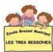
EBM Les Tres Bessones