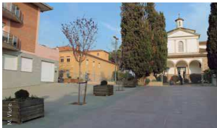
Les actuacions s'han dut a terme davant l'entrada de l'església