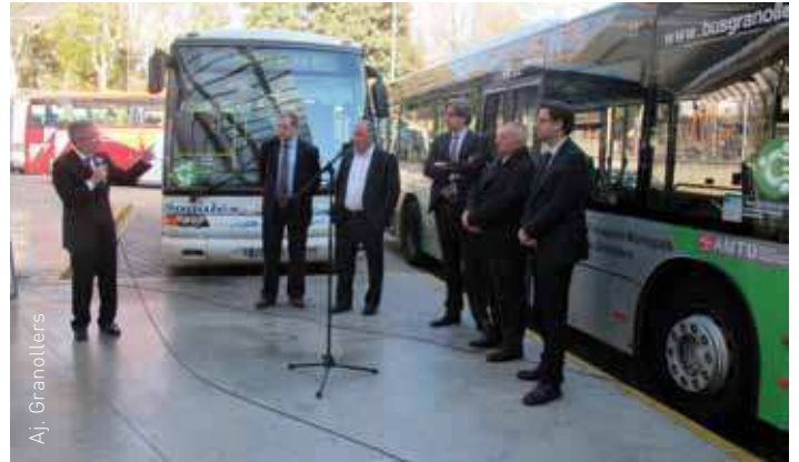
Properament s'elaborarà un horari de butxaca comú per als usuaris

d'ús personal per a jubilats i pensionistes. LF100 / G100 / LR100 / C100 : targeta gratuïta i nominal per a jubilats i pensionistes amb 100 desplaçaments.