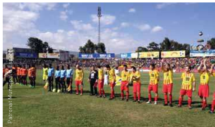
El partit entre el Ramassà i el Saint George estava a punt de començar