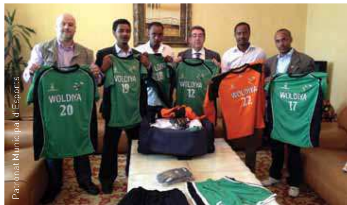
Entrega de material esportiu als representants de Woldiya