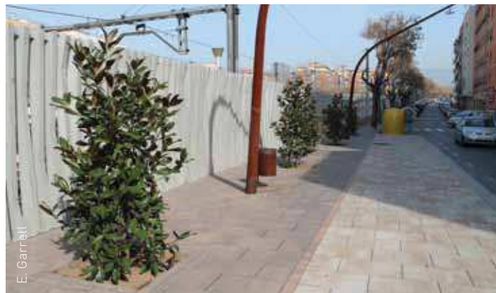
Aquests arbres faran molta ombra quan siguin grans