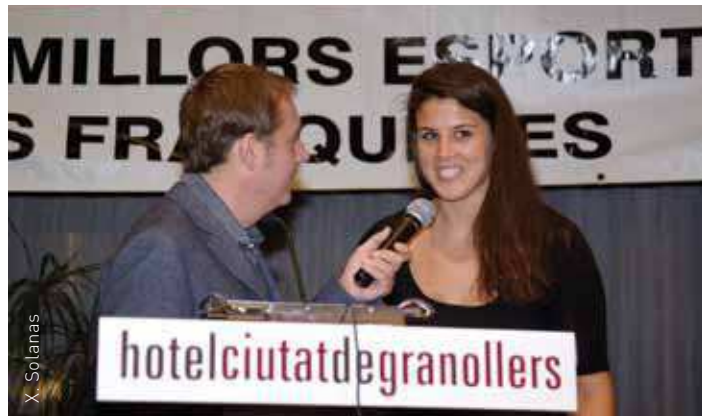
La convidada d'honor va ser la pilot Laia Sanz

E l divendres 28 de febrer els esportistes de les Franqueses es van vestir de gala per celebrar la seva festa a la 18a Nit de l'Esport. Fins a 450 persones es van reunir a l'Hotel Ciutat de Granollers. La Nit de l'Esport, organitzada pel Patronat Municipal d'Esports, es celebra cada any per fer un reconeixement públic i premiar aquells esportistes, persones i entitats locals que han destacat pel seus èxits i dedicació durant la temporada 2012-13.