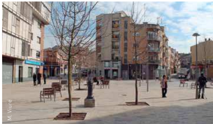
La plaça d'Espanya vista des de la terrassa d'un edifici