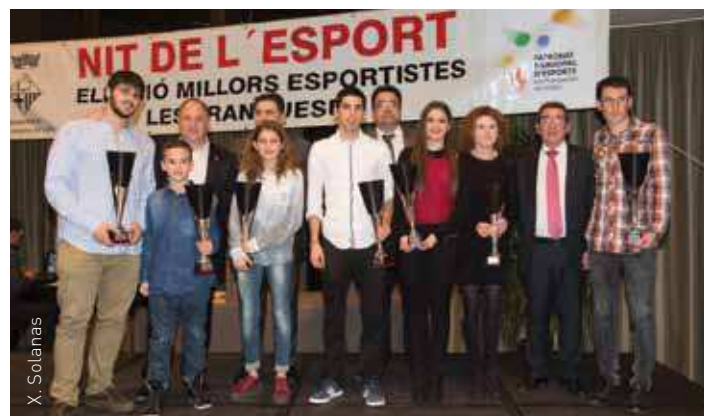
Més de 450 persones van gaudir de la gala