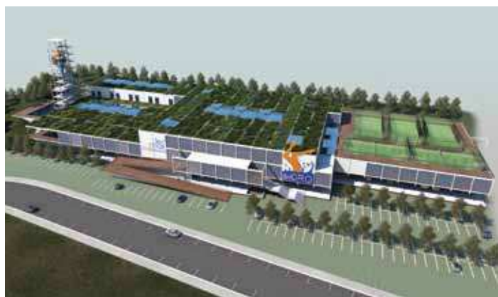
Imatge virtual del futur centre de natació sincronitzada