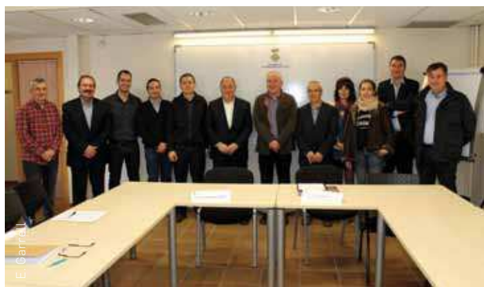
Membres de la junta de l'associació i representants del consistori