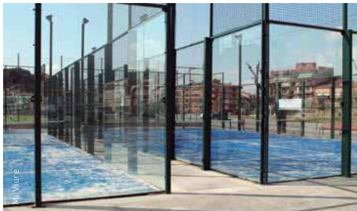
Les pistes de pàdel 2 i 3 de Corró d'Avall

Les pistes de pàdel de la Zona Esportiva Municipal de Corró d'Amunt també tenen aquest tipus de gespa des del mes de juny de l'any passat.