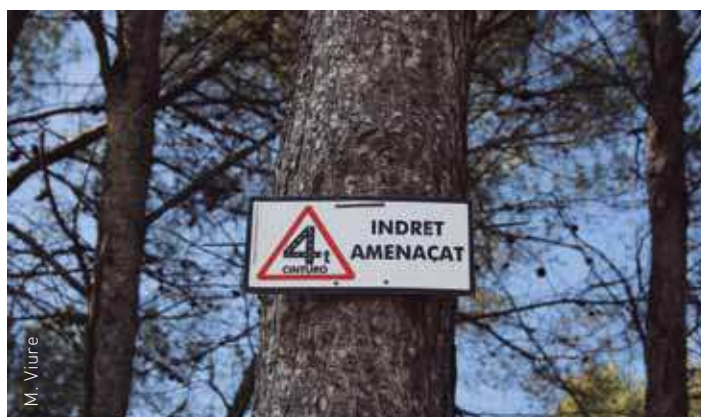
Bosc de Marata

La modificació puntual del PGOU aprovada en el Ple municipal del 29 de gener implica alliberar 182 hectàrees de terreny , el que significa el 6% del terme municipal de les Franqueses.