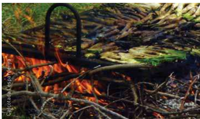
Està prohibit fer foc sense autorització del 15 de març al 15 d'octubre

Com cada any, l'àrea d'Agricultura, Territori i Sostenibilitat de l'Ajuntament recorda que està prohibit fer foc sense autorització del 15 de març al 15 d'octubre en els terrenys forestals i a la franja de 500 metres que els envolta. El document per demanar-ne el permís es pot descarregar a l'apartat de tràmits del web municipal. Especialment, no es poden cremar restes de poda i d'aprofitaments forestals, agrícoles o de jardineria, ni marges pròxims a zones forestals, sense una autorització expressa del Departament d'Agricultura. Tampoc no es poden fer focs d'esbarjo ni d'altres relacionats amb l'apicultura. Dins de les àrees recreatives i d'acampada i en parcel·les de les urbanitzacions, es podrà fer foc quan s'utilitzin barbacoes d'obra amb matagospires.