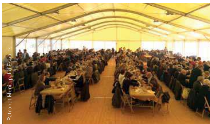
Patronat Municipal d'Esports

La calçotada va acabar amb la tradicional rifa de paneres amb productes de la terra i un lot de neteja de productes KH7.