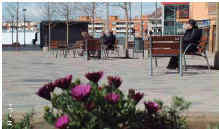
Les jardineres ajuden a delimitar l'espai que és exclusiu per als vianants

APADIS, amb seu a Bellavista, promou la integració educativa, social i laboral de les persones amb discapacitat. La fundació, que