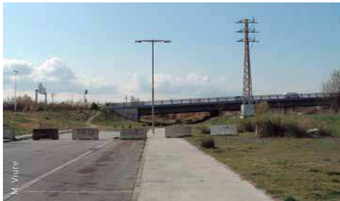
El carrer de la Ribera del Congost, tallat a l'espera de les obres d'enllaç

En diverses ocasions els empresaris del polígon El Congost han exigint el compliment del conveni. Ara, a través de l'Associació d'Empresaris i Propietaris dels Polígons Industrials de les Franqueses, és una de les peticions principals d'aquest sector, juntament amb la millora de la velocitat d'internet.