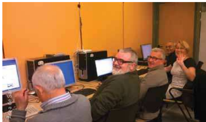
Una classe del Casal d'Avis i Centre Social de Bellavista

L'àrea de Sanitat i Gent Gran agraeix l'aportació de l'Obra Social "la Caixa" i, en especial, les gestions realitzades pel delegat de l'entitat a l'oficina de Bellavista.