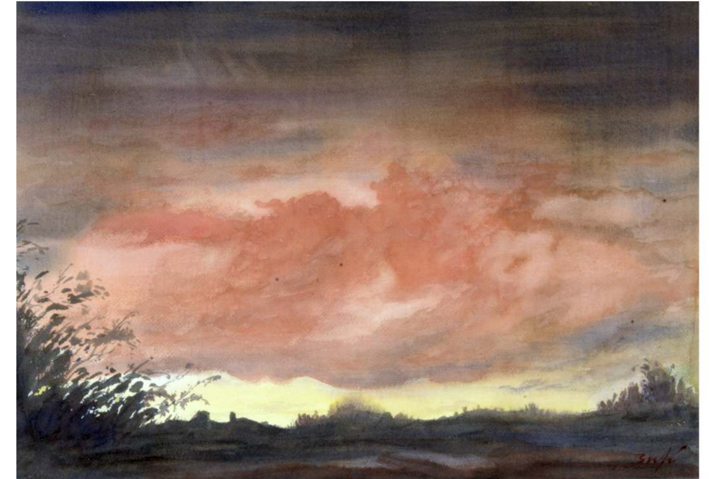
Cap tard (Llerona) | Aquarel·la 52x38 cm