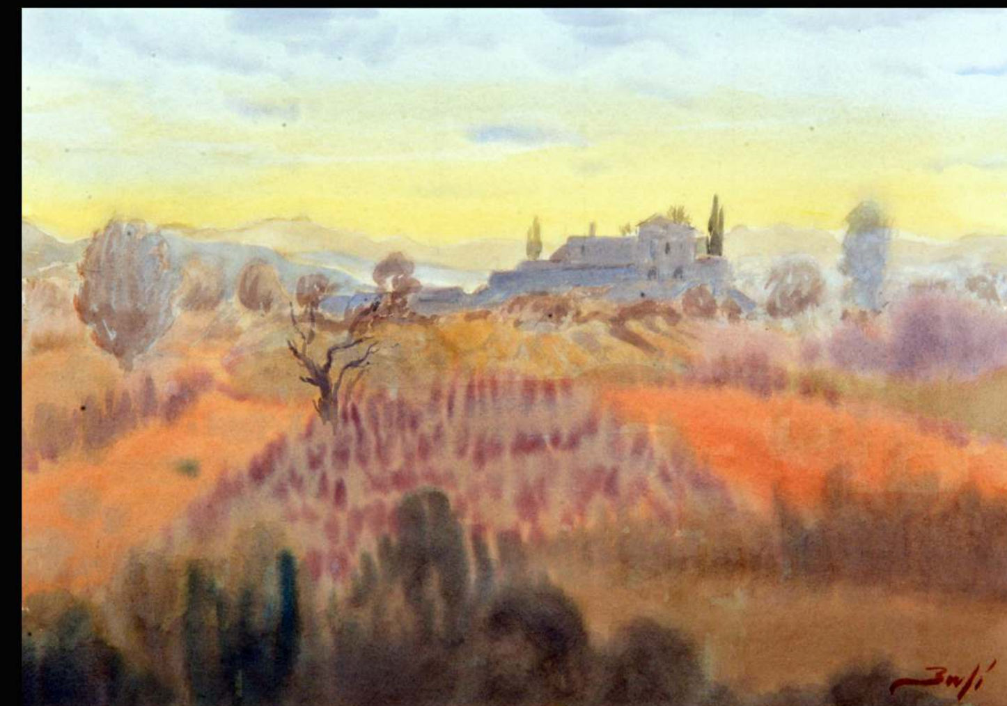
"Paisatge" (Llerona) | Aquarel·la 52 x 32 cm

Artemisia Art & Tendències GALERIA de ARTE