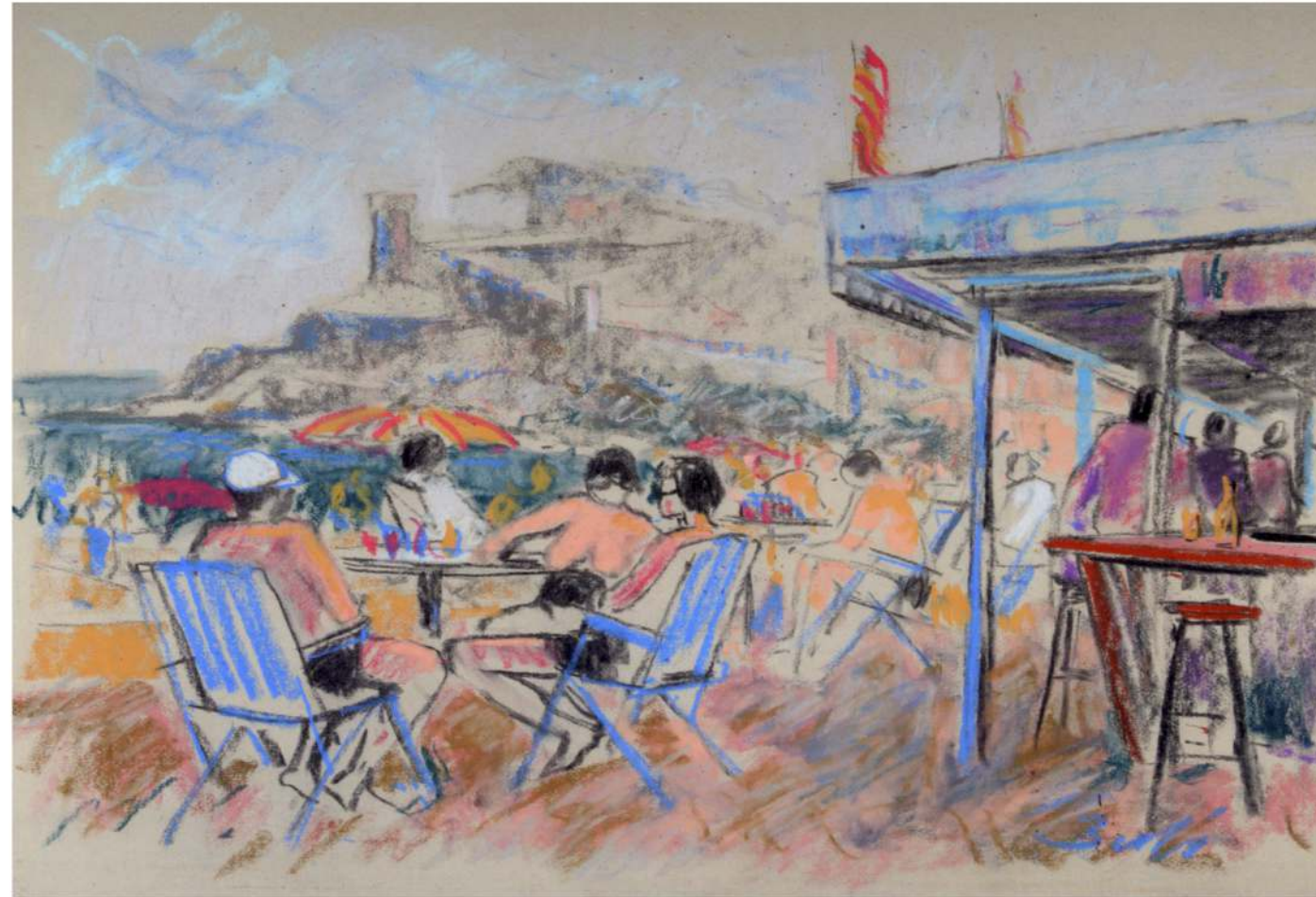
Tossa | Dibuix 65x50 cm