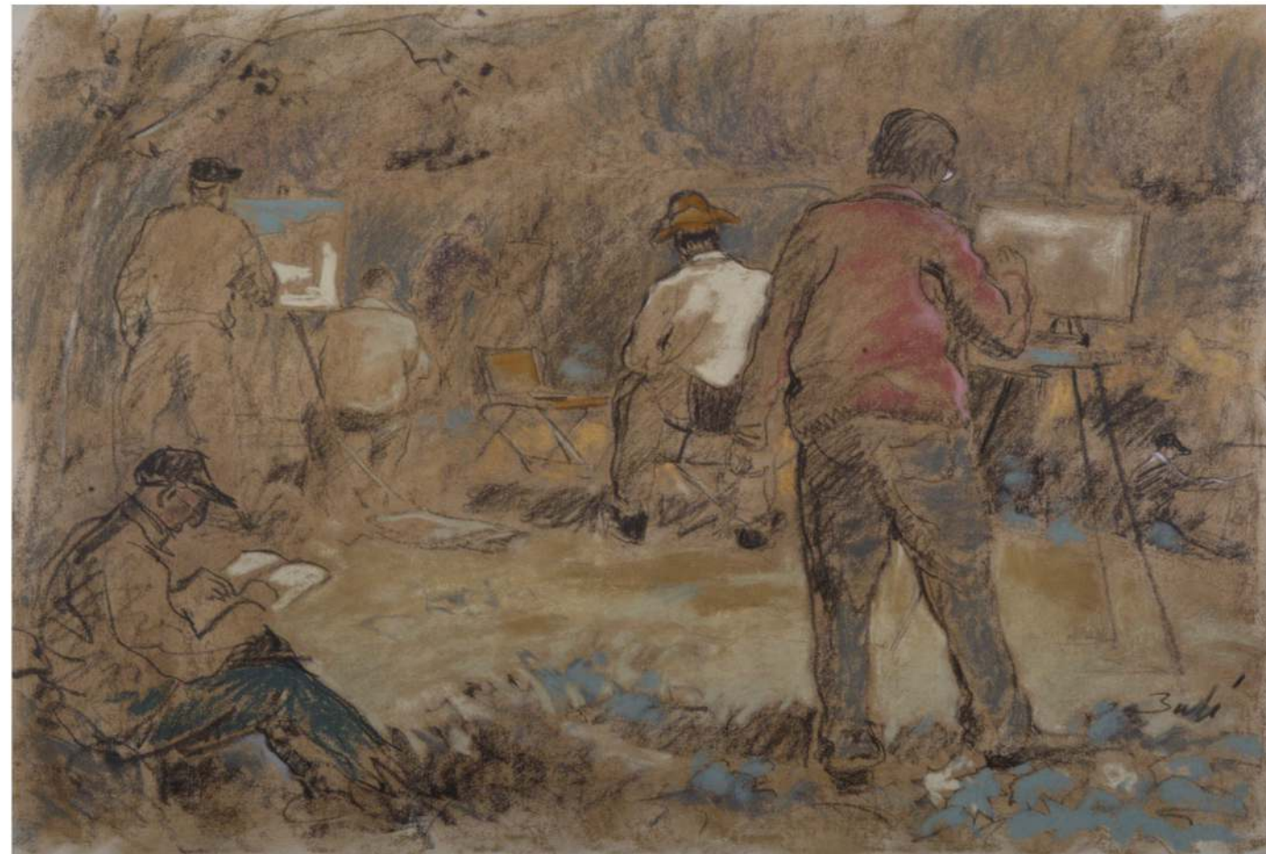
A ple art | Dibuix 65x50 cm