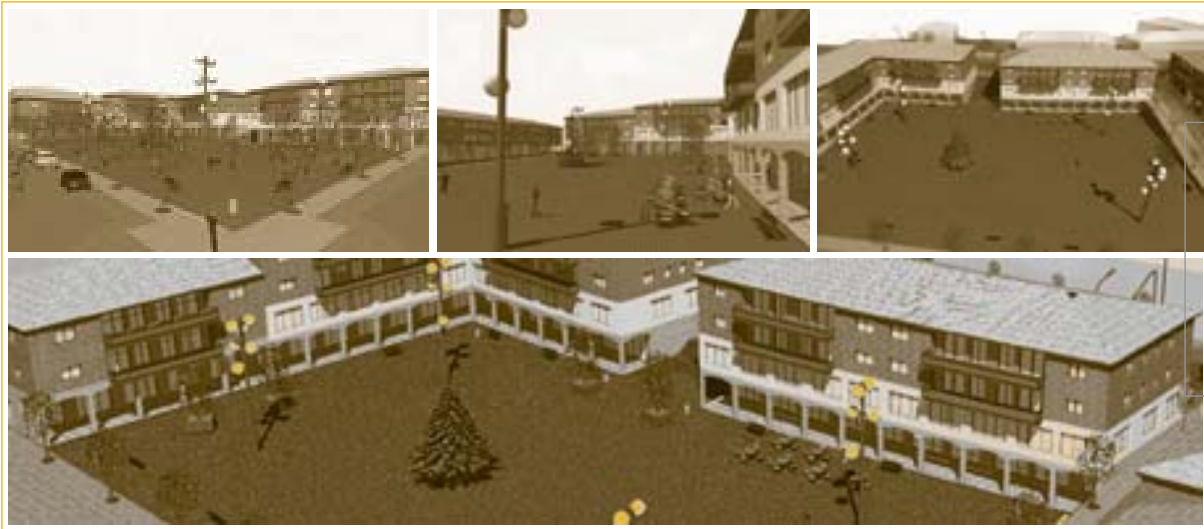
Diferents imatges virtuals de la probable fesomia que acabarà tenint la plaça de l'Espolsada

Un cop fets els treballs de construcció de la part central de la plaça de l'Espolsada, que es van acabar el mes de maig, ara li toca el torn a la urbanització dels seus voltants. Aquesta urbanització preveu