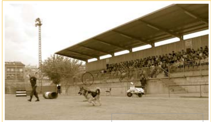
Nens i nenes van veure des de les grades les evolucions dels gossos

Aquest va ser un esdeveniment excepcional, ja que normalment la secció canina de la GU de Barcelona no realitza activitats fora de la capital catalana. Els assistents a l'exhibició van poder veure diverses mostres d'ensinistrament de gossos, obediència, reducció i de-