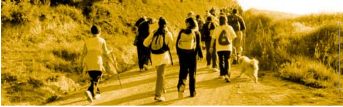
Un grup de participants en una de les pujades del recorregut de la caminada