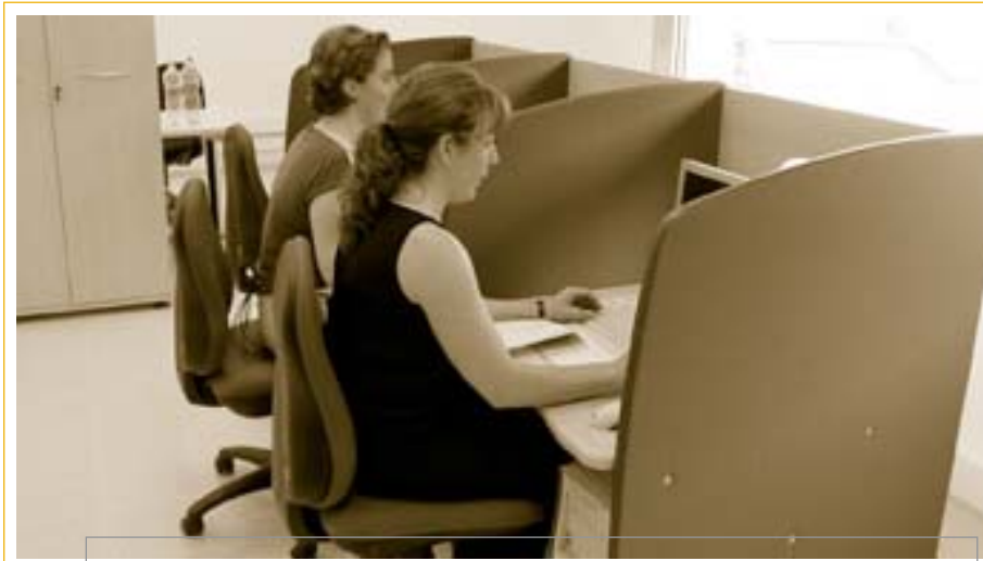
Un dels quatre despatxos on ja hi ha una empresa de nova creació instal·lada i treballant

sa dedicada a la importació, exportació i distribució, en exclusiva, de productes esportius (bowling i ciclisme) i vins i licors.