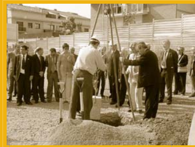
Les autoritats presents en el moment de posar la primera pedra de la residència al solar situat al costat del Casal d'Avis i Centre de Dia

L'Ajuntament ha cedit el solar i la construcció anirà a càrrec de l'empresa Contratas y Obras. L'equip d'arquitectes Codina, Prat i Valls és