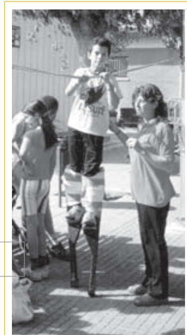
El taller de xanques va ser molt concorregut

taller de xanques, animat pels infants que ja fan el taller durant tot el curs. A més, es va realitzar un taller de barrets, i tot un ventall de jocs de carrer.