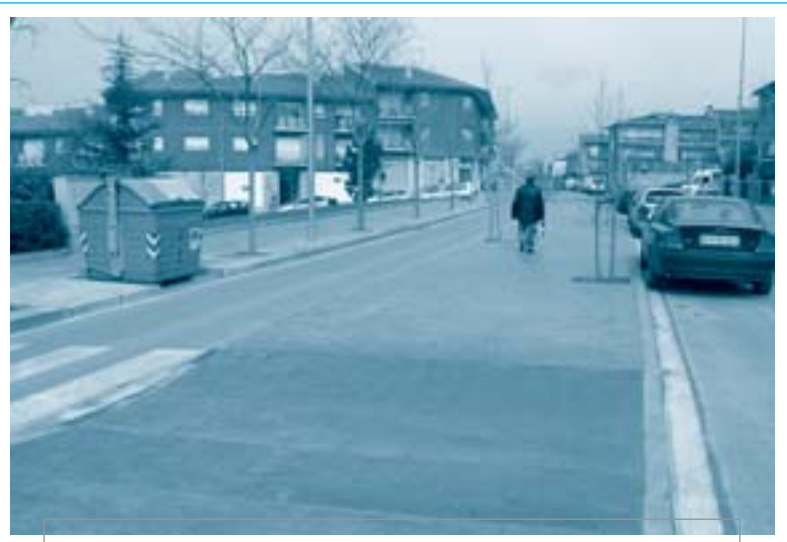
La mitjana separa de manera més efectiva els dos carrils de circulació

A banda del carrer del Tagamanent, que té uns 700 metres de llargada i va de la carretera de Cànoves fins a l'avinguda de l'Ajuntament, també s'ha fet el mateix en un tram del carrer de Cèlecs. Així doncs, s'hi ha fet una vorera elevada de 3,80 metres d'amplada tot al llarg del carrer, respectant sempre les interseccions que existeixen amb la resta de carrers, que s'ha construït a base de formigó imprès de color i