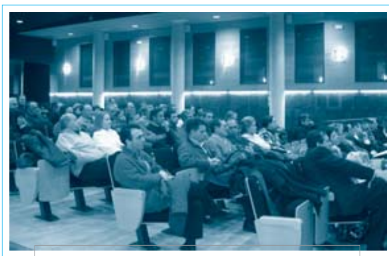
La taula rodona va atraure molts ramaders d'arreu de la comarca

Atès que la problemàtica de les dejeccions ramaderes és un dels temes de més transcendència en el món agrícola, i davant de les declaracions de determinats indrets com a zones vulnerables, des de l'Àrea de Dinamització Econòmica, juntament amb el Consell de la Pagesia de les Franqueses, es va veure la necessitat d'organitzar una taula