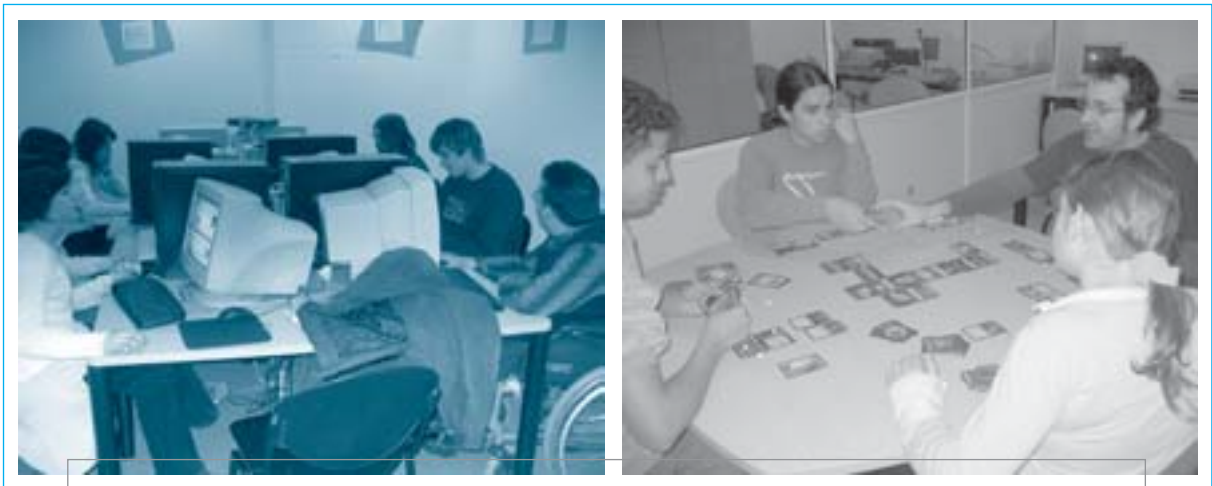
L'espai d'informàtica i el dedicat a les partides de rol són dos espais molt consolidats dins dels Centres de Joves

La joventut representa la llibertat, el moviment, la iniciativa, el confrontament, el descobriment, la lluita, el rebuig, el reconeixement, el conflicte... Els/les joves s'endinsen en un món nou i desconegut en el que han de trobar el seu lloc. Aquest viatge homèric sempre s'ha realitzat acompanyat i amb ajuda per resoldre els problemes que van sorgint.