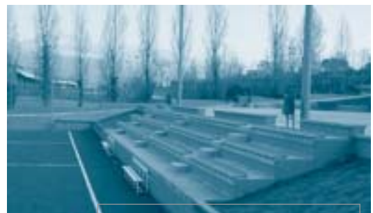
Les noves cadres que s'han instal·lat a les grades del camp de futbol

Les obres han consistit en la instal·lació de gespa artificial de darrera generació al camp de futbol-7, la pavimentació de la pista de bàsquet existent i de l'entorn del camp de futbol i la construcció d'una nova pista poliesportiva. La darrera actuació que s'hi