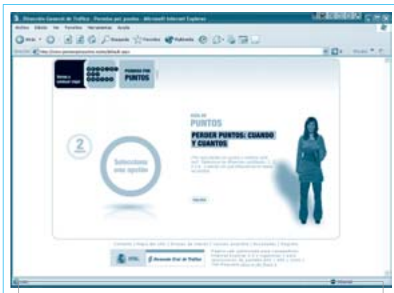
El web www.permisoporpuntos.es informa sobre el nou carnet de conduir

Per infraccions greus o molt greus que aniran minvant els punts. Depenent de la infracció es podran perdre 2, 3, 4 o 6 punts.