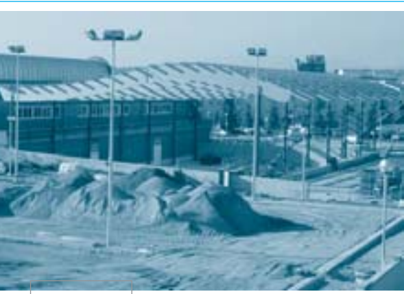
La col·locació de les grans bigues al sostre de la pista va ser espectacular

Les obres de la pista poliesportiva semicoberta que estan construint al costat del pavelló, a la zona esportiva municipal de Corró d'Avall, estan molt avançades després de completar la instal·lació, els últims mesos, del sostre amb les espectaculars bigues que l'aguanten. La previsió és que al mes de maig pugui estar a punt per poder-ne fer ús.