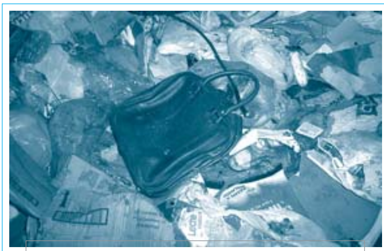
Seleccionar correctament la bossa no costa tant, només és posar-s'hi

Ara fa uns tres mesos que vam iniciar al nostre municipi un nou repte per a tothom en matèria de recollida selectiva, a l'instal·lar nous contenidors de major capacitat i bicompartimentats, per tal de poder separar la fracció orgànica de la de rebuig. Es tractava, doncs, d'una nova experiència on tots i cada un de nosaltres tenia la possibilitat de fer-ne ús, millorant d'aquesta manera el medi ambient i reduint el cost de la seva gestió SI HO FEM BÉ.