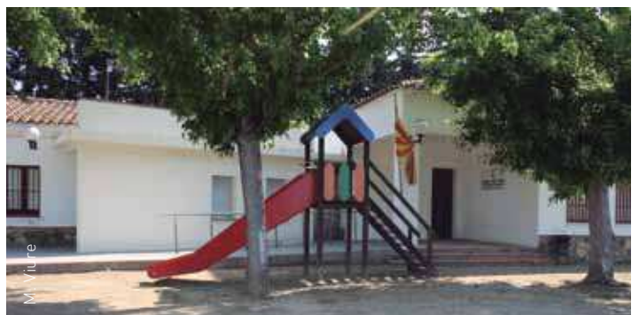
Inversions de millora als Consells del Poble de Llerona i Corró d'Amunt