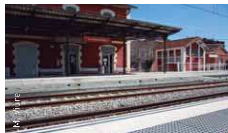
Millores efectuades a la mobilitat i seguretat

Per tal de facilitar als maquinistes les operacions d'entrada i de sortida de persones del tren i augmentar la seguretat de les andanes, s'ha instal·lat un sistema de càmeres i miralls.