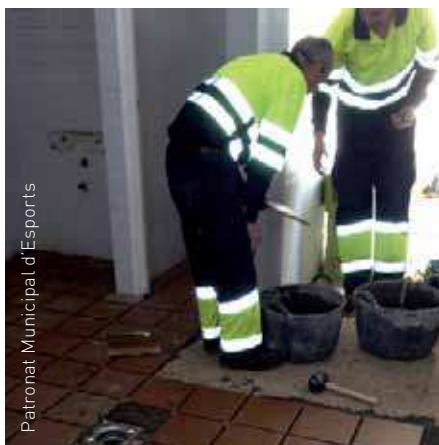
Patronat Municipal d'Esports

El Pla de millores a les instal·lacions esportives es desenvolupa en l'actualitat a la zona esportiva de Corró d'Avall on es duu a terme la remodelació dels vestidors del pavelló aprofitant els operaris del Pla d'Ocupació de l'Ajuntament.