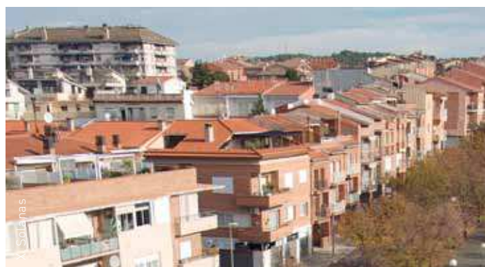
El Fons Social de Vivendes el gestiona les entitats bancàries

Els interessats s'han d'adreçar als bancs i caixes. Els Serveis Socials s'encarregaran d'emetre, a petició de les entitats financeres, un informe sobre la necessitat o risc social dels sol·licitants de vivendes.