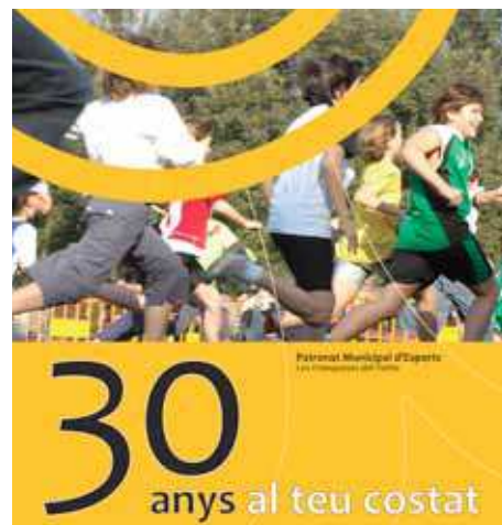
Portada del llibre

El Patronat és un organisme autònom creat per l'Ajuntament de les Franqueses l'any 1982. Va néixer amb la finalitat d'administrar i gestionar els serveis municipals propis de l'àmbit esportiu. Les seves funcions són fomentar i promoure l'activitat físicoesportiva entre la població franquesina i gestionar, ja sigui directament o indirecta, les instal·lacions esportives municipals.