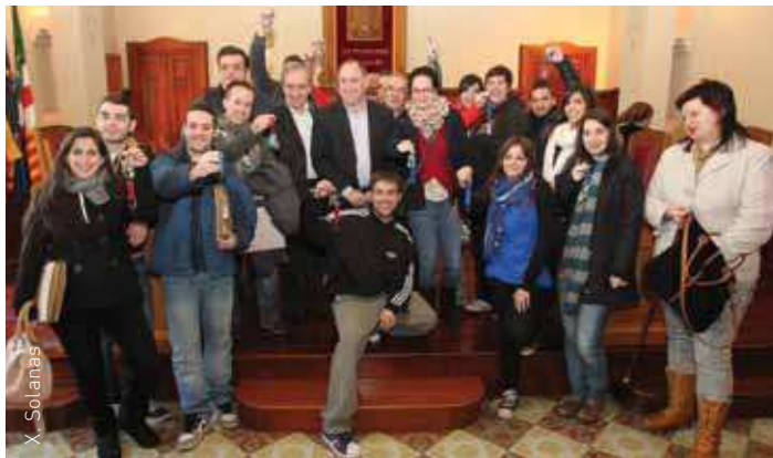
Els nous llogaters després de rebre les claus dels pisos

El 25 de febrer va tenir lloc a la Sala de Plens de l'Ajuntament l'acte de signatura dels contractes i el lliurament de les claus de 13 habitatges de lloguer per a gent jove de protecció oficial ubicats a Corró d'Avall i Bellavista que s'havien sortejat el 6 de febrer.