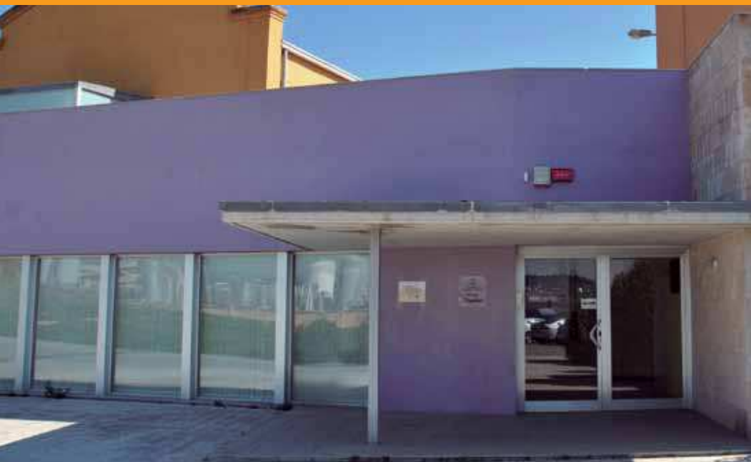
El Viver d'Empreses es troba al carrer Cal Gabatx de Corró d'Avall