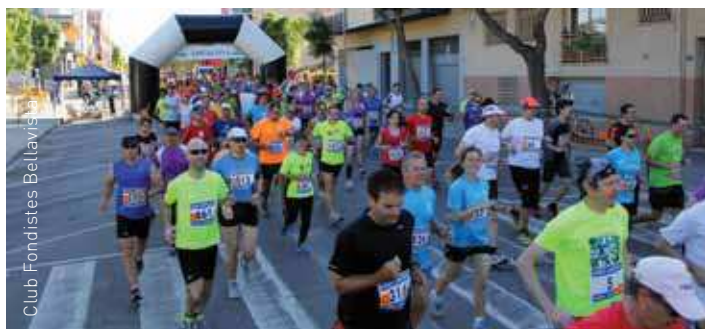
Sortida des de la plaça Major de Bellavista