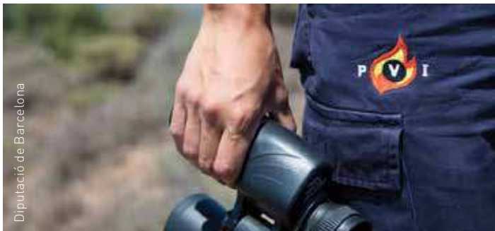
Diputació de Barcelona

Les Franqueses entra dins d'una de les 13 rutes de vigilància forestal juntament amb Cardedeu i Sant Antoni.