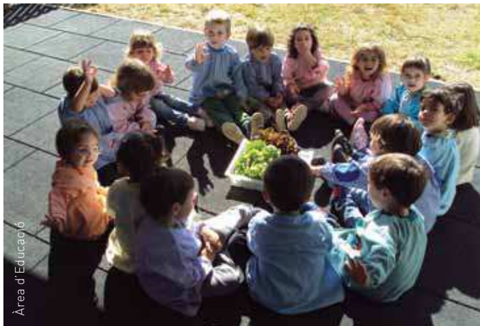
Tots els nens i nenes van poder plantar les llavors i els planters

El projecte 'l'hort a la nostra Escola' és una experiència enriquidora pel procés d'ensenyament dels alumnes. El projecte també permet treballar àmbits com la col·laboració, la constància, el compartir i aporta aprenentatges envers la natura, els aliments, el creixement, el saber esperar i la relació intergeneracional.