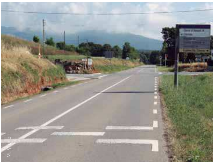
La Diputació de Barcelona ha estat la responsable de les obres

L'Ajuntament de les Franqueses i la Diputació de Barcelona, titular de la BV-5151, van signar un conveni per a la millora de la senyalització i la seguretat de la cruïlla de la carretera de Cànoves amb el camí de Marata. L'actuació, amb un import total de 56.047 euros, ha estat assumida en el 98% per la Diputació de Barcelona, 54.926 euros, mentre que l'Ajuntament s'ha fet càrrec del 2% de l'obra, és a dir, 1.120 euros.