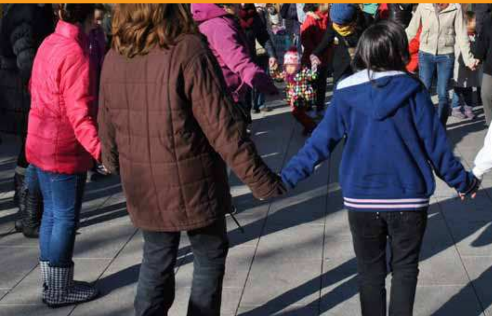
L'àrea promou activitats puntuals i anuals com el Dia de la Dona