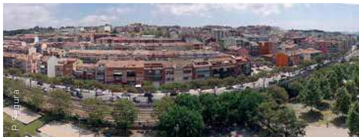
Panoràmica del barri Bellavista

Totes les activitats, els tallers, les fotografies, els vídeos i els estats de les obres al barri a només un clic.