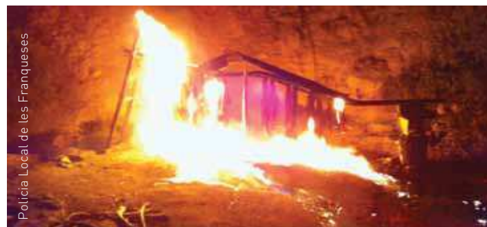
Crema dels plàstics que protegien els cables de coure

El presumpte autor del foc va ser detingut i traslladat a les dependències dels Mossos d'Esquadra per la seva custòdia i posterior presentació davant l'autoritat judicial. El propietari de la finca on van ocórrer els fets també haurà de respondre davant del jutge. Els Mossos investiguen la procedència dels cables.