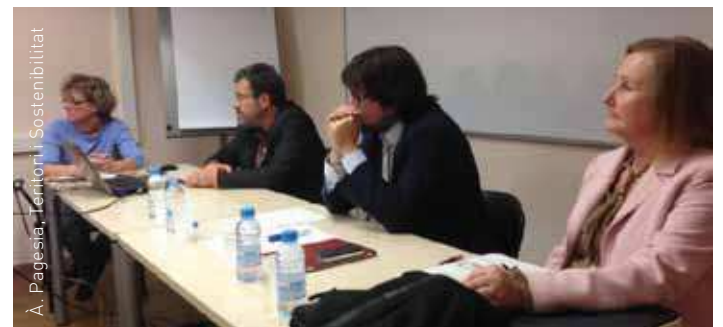
A. PAGESIA, Territori i Sostenibilitat

Malgrat que la previsió per portar a terme el projecte és a molt llarg termini, no es contempla la desafectació dels terrenys per on està dibuixat el Quart Cinturó.