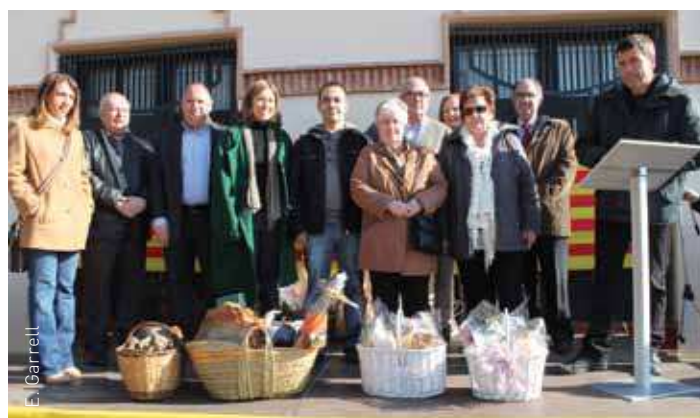
Entrega de premis del 2n Concurs de Cuina

Mentre s'esperava la deliberació del jurat del Concurs de Cuina, els assistents van poder comprar producte de proximitat a alguna de