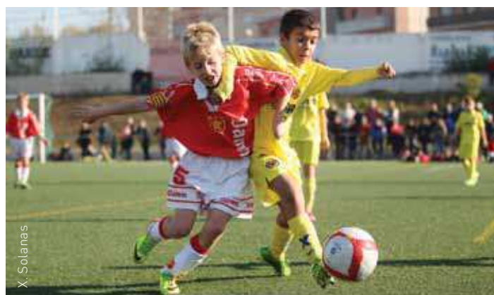
Les finals es van disputar a la Zona Esportiva de Corró d'Avall