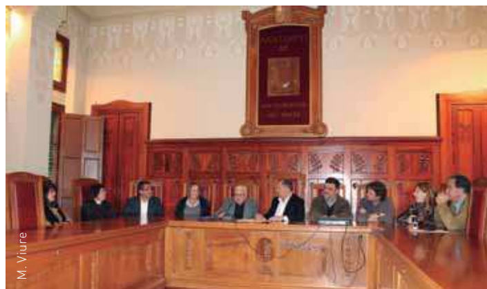
Diversos regidors es van reunir a la sala de plens durant l'acte

El projecte de remodelació respectarà l'entorn rural i el patrimoni històric-cultural que representa l'església de Santa Maria de Llerona. La redacció del projecte va a càrrec de tècnics de la Diputació de Barcelona i el cost de les obres oscil·larà entre els 400.000