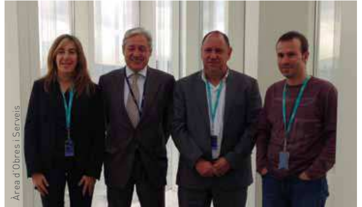
Àrea d'Obres i Serveis

La instal·lació de la fibra òptica és una iniciativa privada de la companyia Telefònica. Per tant, la col·locació dels cables no té cap cost per a l'Ajuntament. En tots els casos, Telefònica sol·licitarà permís als propietaris dels immobles per estendre-hi els cables. La instal·lació del cablejat és gratuïta i també cal tenir present que en cas de no autoritzar-la es frenarà el correcte desplegament de fibra a la zona . Els tècnics de l'empresa remarquen que si un edifici impedeix la instal·lació de la xarxa és possible que impedeixi l'accés a l'edifici veí.