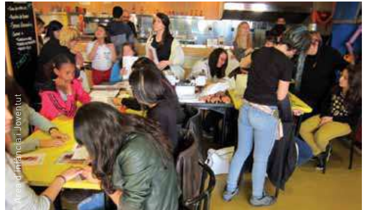
El bar del Centre Cultural de Bellavista en plena inauguració

Els usuaris del Centre Municipal de Joves es van implicar directament en l'organització de l'acte, que va comptar amb la col·laboració i presència d'entitats com els Diablers Encendraires, les colles de Bellavista Guillots i Suats, i iniciatives privades com l'Escola Estudi i Imatge de Granollers, que van organitzar activitats vinculades a la seva formació.