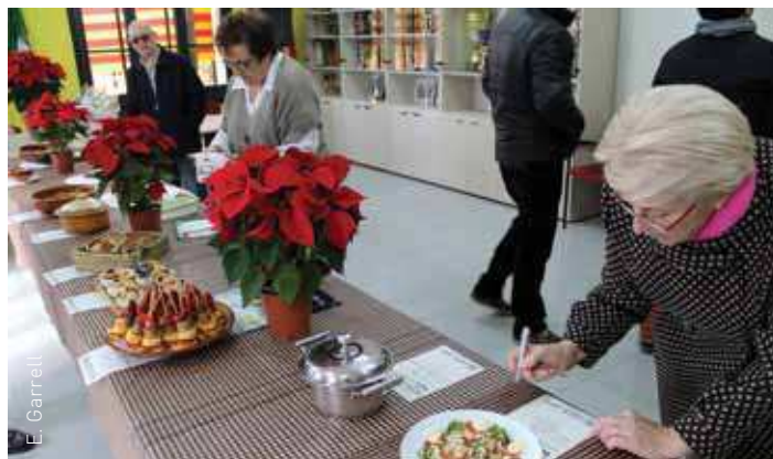
El llibre inclourà receptes premiades a la Festa de la Mongeta del Ganxet

Pel que fa a les obres que han d' ampliar un dels dos lavabos del Consell per fer-lo apte per a l'accés de persones amb mobilitat reduïda , així com les que han d'arranjar l'arrebossat de la façana, Pruna va dir que està previst que comencin durant les properes setmanes, amb l'ajut de dos plans d'ocupació.