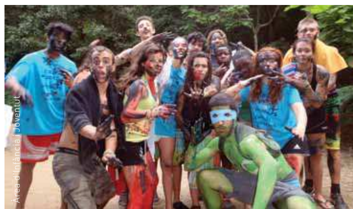
Una de les edicions dels campaments per a joves

formalitzar del 5 al 16 de maig al Casal Infantil Municipal de Bellavista (ubicat al Centre Cultural de Bellavista) dimarts de 10 a 13 h i dilluns i dimecres de 15.30 a 18.30 h o al Casal Infantil Municipal de Corró d'Avall (ubicat al Centre Cultural Can Ganduxer) dijous de 10 a 13 h i dimarts, dijous i divendres de 15.30 a 18.30 h. Les places són limitades i l'admissió anirà per sorteig. Per a més informació, adreceu-vos al 938 405 780 o infanciaiyoventut@lesfranqueses.cat .