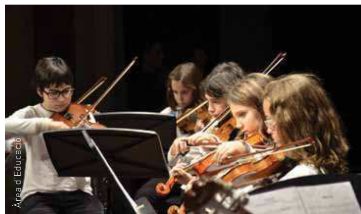
Concert dels alumnes d'instrument

L'escola ofereix classes d'instrument, formació musical infantil (sensibilització per a nens de 3 a 5 anys; i el programa bàsic de llenguatge, instrument i conjunt) i formació musical per a joves i adults (també amb programa bàsic; el programa avançat de Grau Professional no reglat; etc.). El període de matriculació per al curs vinent serà del 12 al 23 de maig de 16 a 19 h per als empadronats al municipi, i del 26 de maig al 13 de juny, de 16 a 19 h, per a tothom.