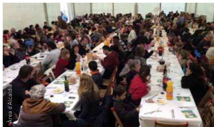
L'arrossada va omplir de gom a gom la carpa de la festa

L'acte més popular va ser l'arrossada amb més de 400 persones. Durant el dinar, els antics membres de la Coral Xeremella van cantar