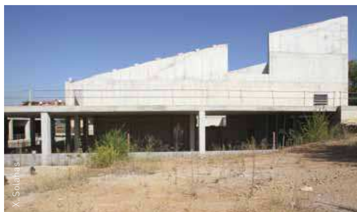
Estat actual del Centre Cultural de Corró d'Avall

La proposta número 1 planteja que l'edifici inclogui un Centre d'Atenció Primària (CAP) (veure el plànol: zona 1, planta baixa), una sala polivalent per a activitats esportives, culturals i socials (zona 1, planta superior), un pavelló poliesportiu de tipus 1 (PAV1) i usos complementaris esportius (zona 2) i una biblioteca municipal i/o sales polivalents de formació i estudi (zona 3). Per a la zona 4, s'inclou un espai públic transitable i altres usos complementaris, com per exemple, un hotel d'entitats; oficines dels serveis municipals de Cultura, Educació, Infància i Joventut; oficines dels serveis municipals de Políti-