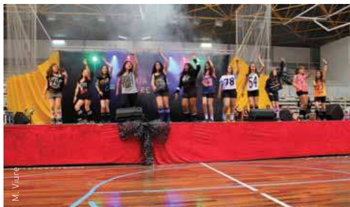
A l'Escola de Dansa de l'AV s'ensenyen diferents estils de ball