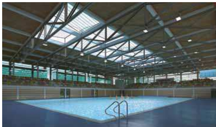
Piscina de competició amb grades amb capacitat per a 1.400 persones