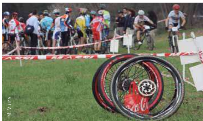
Una de les sortides de la Copa Catalana Intl. disputada a Corró d'Amunt

A banda del vessant purament esportiu, aquest Centre BTT tam-