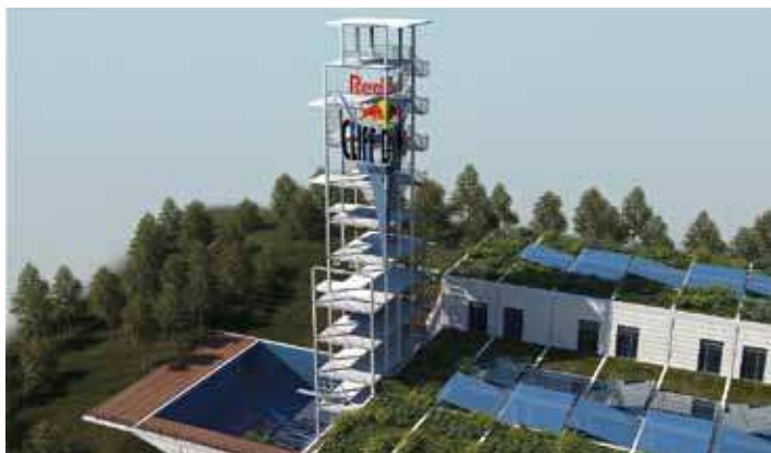
Piscina amb trampolí de 30 m d'altura per fer-hi salts