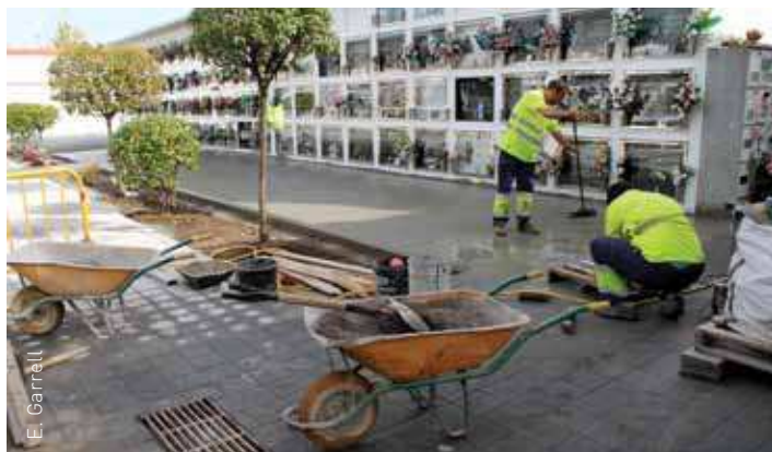
El panot que s'hi ha col·locat és el mateix que hi havia a la part antiga

L'àrea d'Obres i Serveis ha pavimentat la part nova del cementiri de Corró d'Avall amb el mateix tipus de panot que hi havia a la part antiga. Les obres han afectat uns 600 m 2 de superfície i les han realitzat un equip de set persones provinents del Pla d'Ocupació Local de l'Ajuntament.