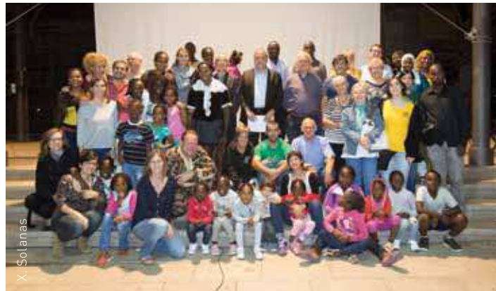
Fotografia de grup dels implicats en el documental

La crònica de la formació del veïnat de Bellavista, a partir de les diferents mirades dels seus veïns i veïnes, centra la línia argumental d'aquest documental en tres eixos: la configuració urbanística, l'associacionisme i els moviments migratoris. El documental retrata la qualitat humana de les persones que hi viuen a la vegada que ex-