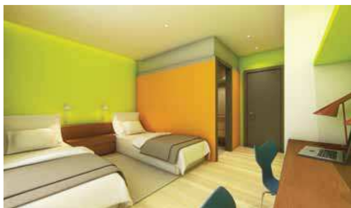
Habitació de la residència