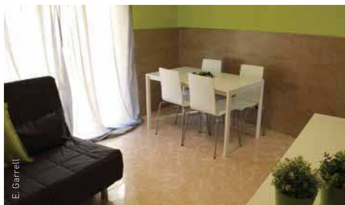
El menjador del pis per a emergències socials

Aquest projecte coexisteix amb altres iniciatives com ara l'adhesió al Fons Social de Vivendes; l'adhesió al conveni entre el Departament de Territori i Sostenibilitat de la Generalitat i Catalunya Banc, SA per a promoure l'ocupació d'habitatges per a destinar-los a lloguer assequible; la coordinació amb l'Agència d'Habitatge de Cata-