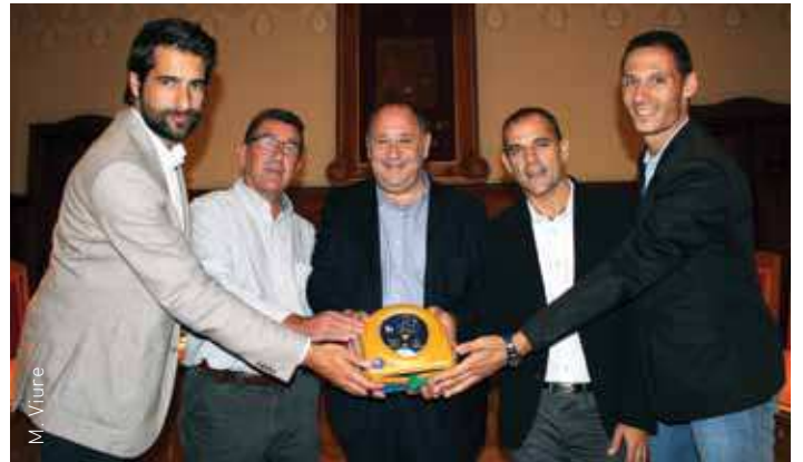
L'alcalde i el regidor d'Esports amb els membres de l'empresa Cardiosos

Els DEA estan connectats telefònicament amb el 112 per activar el protocol d'emergències només obrir la porta de la vitrina on estan col·locats. Els aparells tenen una bateria de 4 anys i un cop per setmana realitzen un autotest per comprovar l'estat de la bateria. A més, l'empresa adjudicatària fa telemàticament una comprovació diària del seu funcionament.