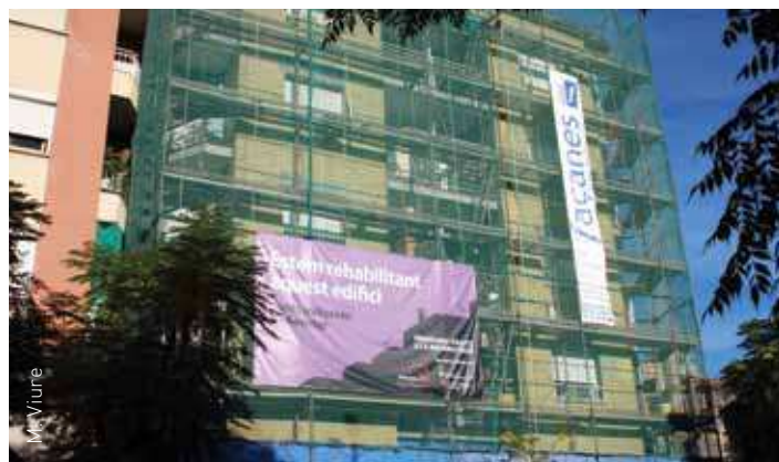
Un dels edificis en rehabilitació, al passeig d'Andalusia

L'origen del programa es remunta al 18 d'octubre de 2010, quan es va signar un conveni de col·laboració entre el Departament de Política Territorial i Obres Públiques de la Generalitat de Catalunya i l'Ajuntament per al desenvolupament del Projecte d'Intervenció In-