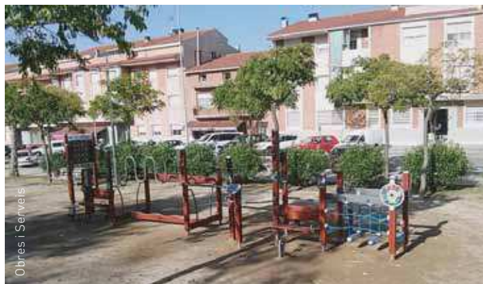
El nou equipament és a la plaça dels Països Catalans

A principis d'octubre es va instal·lar, a la plaça dels Països Catalans –ran del passeig d'Andalusia–, una estructura d'equipaments esportius per a gent gran . L'estructura inclou bancs amb pedals, pedals de mans, taula d'activitats, rampes, barres, ponts mòbils, etc.