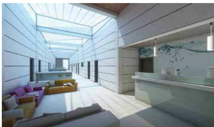
Vestíbul de la residència per a esportistes