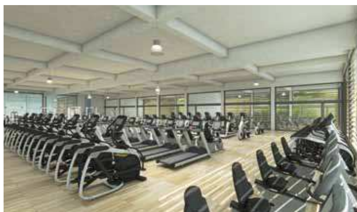
Sala de fitnes