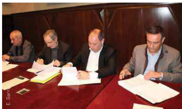
Els quatre alcaldes signen el conveni

Amb la finalitat d'aconseguir una imatge uniforme que identifiqui el servei conjunt, el conveni estableix que els vehicles siguin de color blanc i tinguin rotulat a la porta l'escut de cada ajuntament de procedència. El servei conjunt s'iniciarà quan s'hagi aprovat la tarifa urbana única d'aplicació dels quatre termes municipals, més econòmica que la interurbana, vigent fins ara. S'espera que durant els mesos de gener i febrer els respectius ajuntaments aprovaran la tarifa en els plens municipals i que al març pugui entrar en servei.