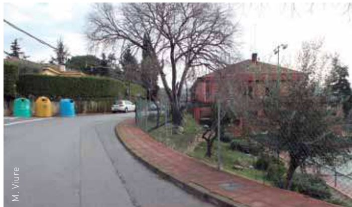
La majoria de les actuacions es concentraran a l'avinguda d'Els Gorchs

Passat el mes de febrer i un cop hagin finalitzat les tasques pen-