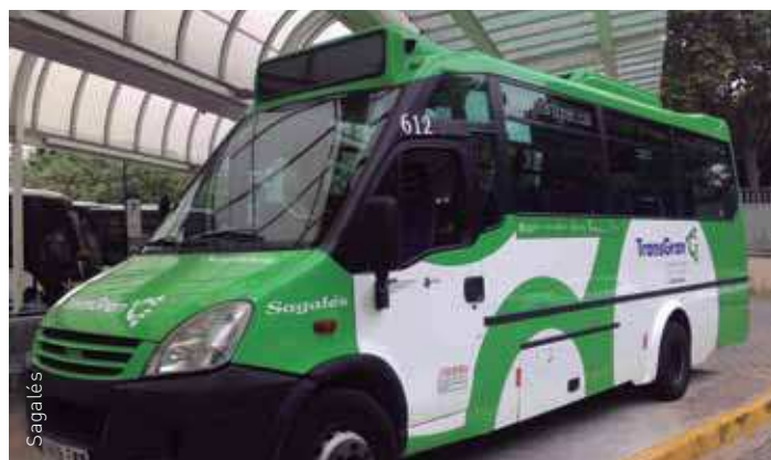
Des de fa prop d'un any la imatge dels autobusos s'ha unificat

Tenint en compte que els dies de servei de la línia han estat gairebé els mateixos (una mitjana de més de 21 al mes), el servei d'autobús de la L6 ha estat satisfactòriament creixent i TransGran i l'Ajuntament de les Franqueses valoren positivament les dades obtingudes.