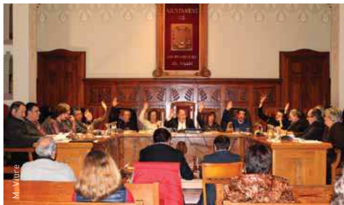
Moment de la votació dels pressupostos

En relació al capítol d'inversions per a aquest any, estan previstes diverses actuacions com ara l'acabament de l'edifici del Centre Cul-