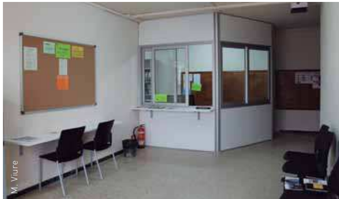
A l'entrada del centre hi ha un nou espai on s'hi ubica la recepció

Al Centre de Formació d'Adults, que depèn del Departament d'Ensenyament de la Generalitat de Catalunya, s'imparteixen ensenyaments de català, castellà, anglès i informàtica, amb especial focus en aquestes dues últimes disciplines acadèmiques. També s'hi imparteixen Ensenyaments Instrumentals, la part comuna per a l'Ac-