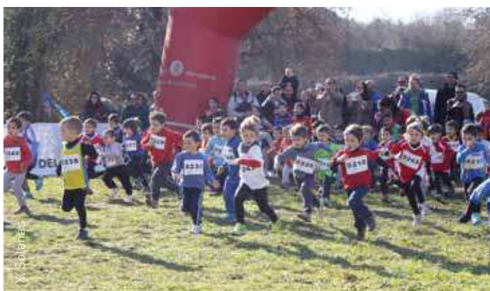
El Cros Escolar és una de les activitats de més èxit del municipi