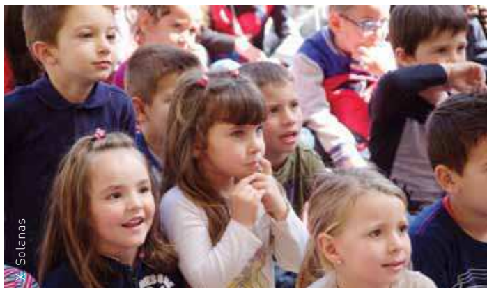
La xerrada-taller comptarà amb servei de monitors gratuït

La xerrada-taller s'emmarca dins del Projecte Educatiu Comunitat i Escola, que compta amb la implicació de les escoles, instituts i