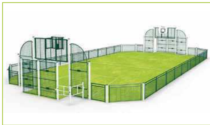
Imatge virtual de la pista poliesportiva

Paral·lelament a aquesta actuació, la brigada municipal adequarà la rotonda de Francesc Macià que connecta el carrer del Pont, de Can