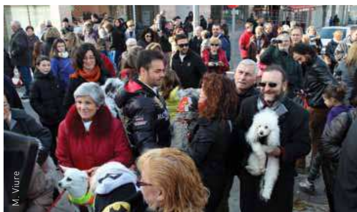
Franquesins i franquesines porten les seves mascotes a la benedicció