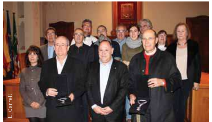
Els homenatjats amb l'alcalde i els regidors del consistori