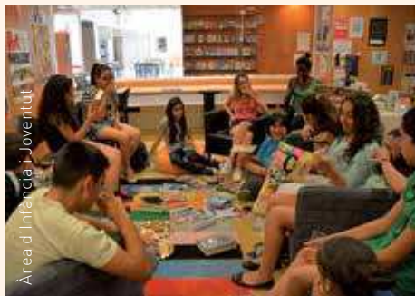
Àrea d'Infància i Joventut

Espai Zero: Berenar de paraules Literatura amb croissants, recomana'ns els teus llibres preferits , dins del programa Ítaca, cultura activa per a joves 17.30-19.30 h Centre Cultural de Bellavista