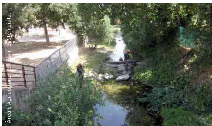
Dos operaris, treballant en el tram urbà de la riera de Carbonell

Aquest tipus d'actuació, que es repeteix a diversos torrents i rieres del municipi, l'hauria de realitzar l'Agència Catalana de l'Aigua, però com que no ho fa, tot i les reiterades demandes que li tramet el consistori, se'n fa càrrec l'Ajuntament.