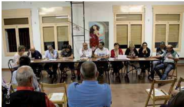
Junta del Consell del Poble de Corró d'Amunt