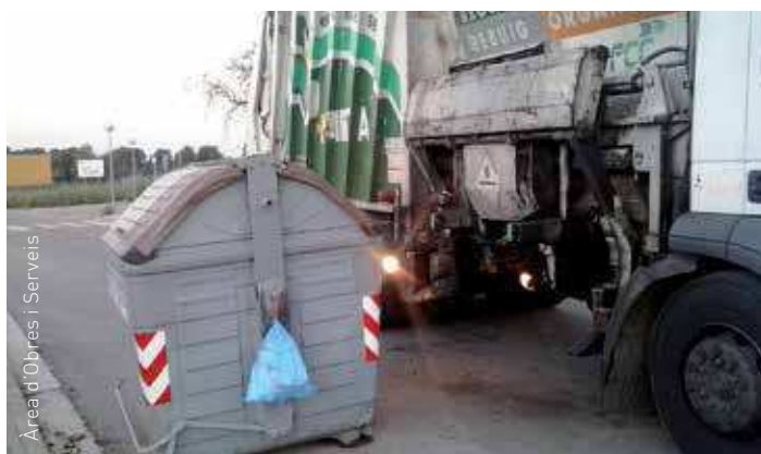
Un camió de l'actual concessionària del servei

El Ple també va aprovar definitivament la normativa per a la