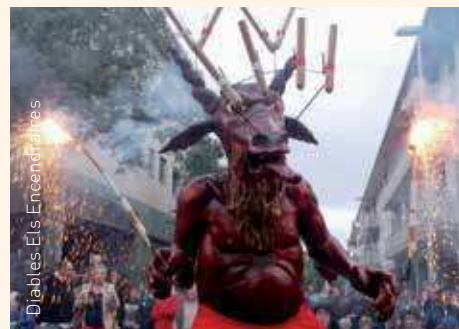
Diablers Els Encendriaires

17 h Punt de trobada amb les colles a la plaça de l'Espolsada i recorregut pels carrers fins a la plaça de l'Ajuntament Org. Grup de Diables Els Encendriaires