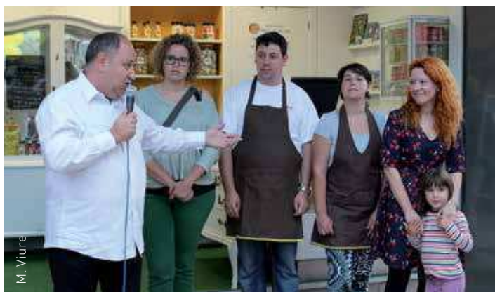
L'alcalde i la regidora, amb els treballadors d'Apadis i la seva directora

El quiosc de la renovada plaça d'Espanya ja és un punt de venda de felicitat alhora que un punt d'informació municipal que permet la integració social i laboral de persones amb discapacitat. El 26 de setembre, Apadis, juntament amb l'Ajuntament de les Franqueses, va inaugurar el Felicitarium.