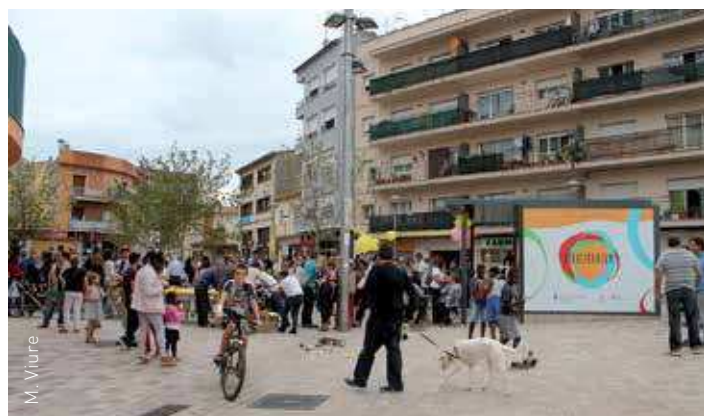
El Felicitarium ocupa l'espai del quiosc de la plaça d'Espanya

L'acte d'inauguració va comptar amb la participació de l'alcalde,