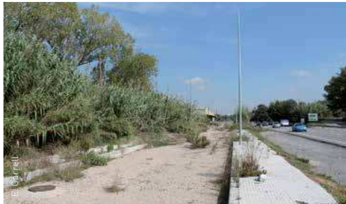
Les obres del sector es van aturar fa anys

El projecte preveu l'aprofitament de totes les obres executades amb el projecte d'urbanització iniciat l'any 2007 i que no s'han malmes durant aquest temps. S'ha realitzat un projecte d'urbanització